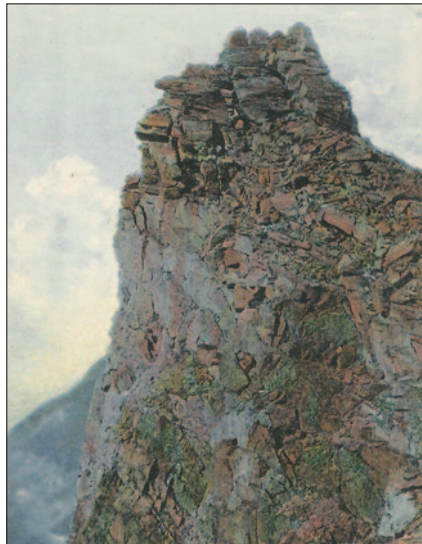
Goldzechhörndl (Postkarte 1905): Mordverdacht vor 100 Jahren