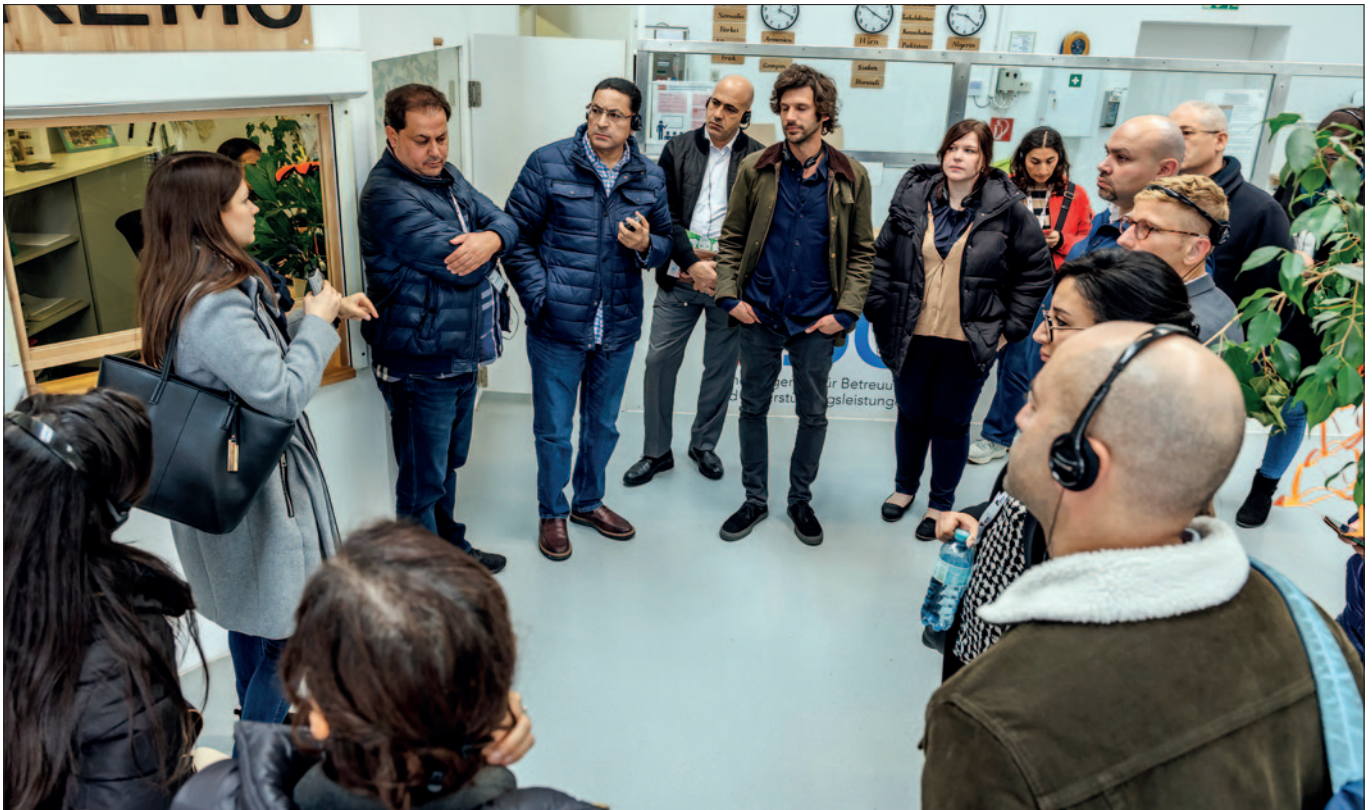
Teilnehmende aus nordafrikanischen Partnerstaaten, EU-Mitgliedstaaten und der EUAA beim Studienbesuch in Traiskirchen