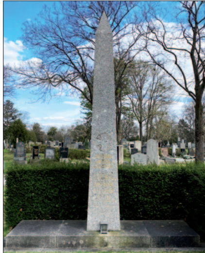
Obelisk im Wiener Zentralfriedhof mit den Namen der getöteten Polizisten der Gründonnerstagsrevolte 1919

Während im Parlament weiterverhandelt wurde, eskalierte vor dem Gebäude die Situation. Demonstranten warfen Steine gegen die Fenster, einige bearbeiteten mit Brecheisen das Eingangstor in der Schmerlinggasse. Sicherheitswachebeamte, darunter Kräfte von der berittenen Abteilung, und Stadtschutzwachleute versuchten, das Parla-