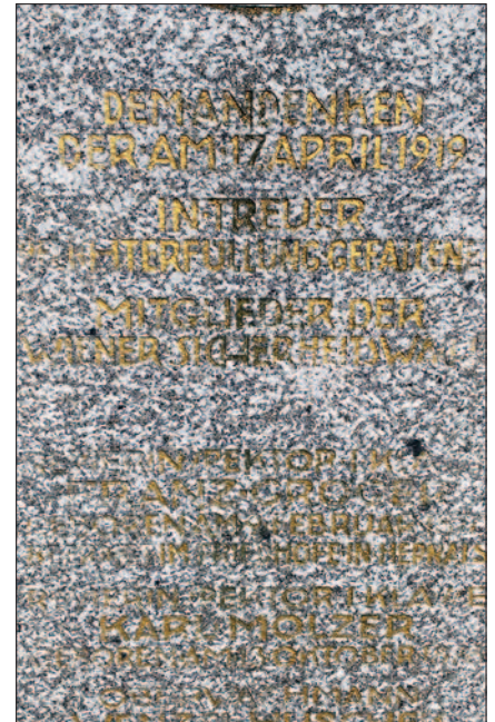
Die goldfarbene Schrift auf dem Obeliken mit den Opfer-Daten ist verwittert

folgen die Titel, Namen, Geburtsdaten und Bestattungsorte der fünf getöteten Polizisten.