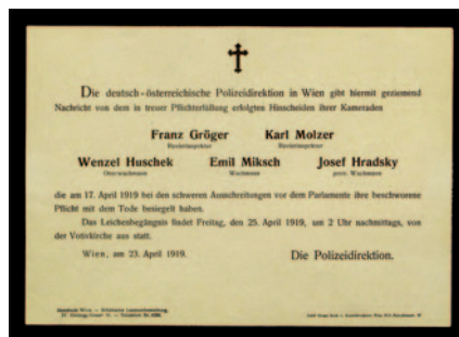
Parte des Innenministeriums für die Opfer der „Gründonnerstagsrevolte“ am 17. April 1919 in Wien

In der Gruppe 66, Reihe 29, des Zentralfriedhofs steht auf einer Bodenplatte ein Obelisk aus hellem Granit. Auf der Vorderseite befindet sich in goldfarbenen Versalien die Inschrift: „DEM ANDENKEN / DER AM 17. APRIL 1919 / IN TREUER / PFLICHTERFÜLLUNG GEFALENNEN / MITGLIEDER DER WIENER SICHERHEITSWACHE“ Es