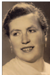
Dienstmagd Apollonia Media

Der Staatsanwalt bezeichnete den Angeklagten als einen „gemeinen, verrohten, bestialischen Menschen, dessen Motive „Mordlust und Habgier“ gewesen seien. Podritschnig wurde vor der Gerichtsverhandlung in einem Drahtkäfig am Neuen Platz in Klagenfurt öffentlich zur Schau gestellt – wie in früheren Jahrhunderten. Nach der Urteilsverkündung wurde Podritschnig in das Landesgerichtliche Gefangenenhaus Wien überstellt. Eine Woche nach dem Todesurteil wurde