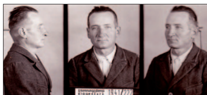
Serienmörder Franz Proditschnig

Der Verdacht der Kriminalpolizei richtete sich auf den 41-jährigen, wegen Eigentumsdelikten mehrfach vorbestraften Franz Podritschnig, der schon nach dem Raubüberfall auf die Pototschnigkeusche in Kaunz in den Fokus der Kriminalpolizei geraten war, aber nicht aufgespürt werden konnte. Er war da-