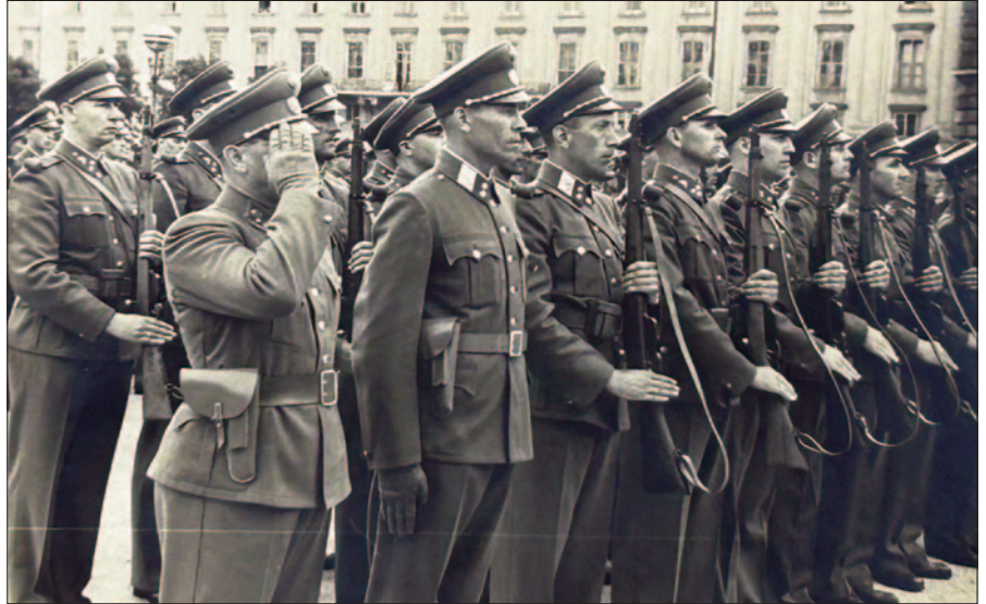
100 Jahre Bundesgendarmerie: Jubiläumsfeier mit Parade im Juni 1949 in Wien