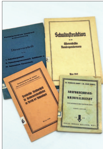
Dienstvorschriften für die Sicherheitswache, die Bundesgendarmerie und das Kriminalbeamtenkorps

Uniformierung. Die Generaldirektion für die öffentliche Sicherheit wies darauf hin, dass die Bestimmungen des Bundesgesetzes vom 21. Dezember 1945, womit ein Verbot des Tragens von Uniformen der deutschen Wehrmacht