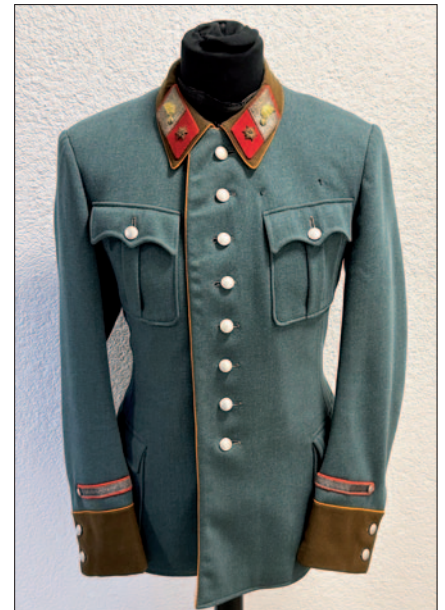
Umgearbeitete ehemalige deutsche Gendarmerie-Uniformbluse mit den Distinktionen der Ersten Republik

Dienstgrade. Aufgrund einer Verfügung des Staatsamtes für Inneres (Erl. vom 22. Mai 1945) war grundsätzlich jener österreichische Dienstrang und Dienstgrad zu führen, den der Beamte am Tag des „Anschlusses“ innehatte. Aufgrund von Wahrnehmungen, dass vereinzelte Exekutivbedienstete nach wie vor Amtsbezeichnungen führten, die sie nach den Vorschriften des Deutschen Reichs erworben hatten, sah sich das BMI noch im Juli 1946 veranlasst, auf die Bestimmungen des § 1 Abs. 3 des Gesetzes vom 22. August 1945 zur Wiederherstellung des österreichischen Berufsbeamtenkorps (BÜH StGBI. Nr.