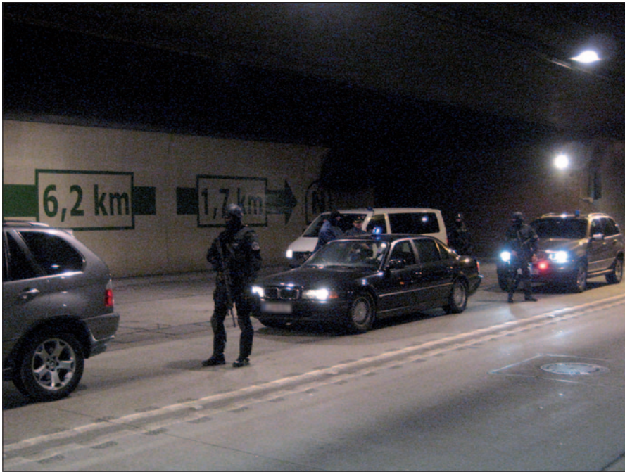
Zivildahnder nahmen einen flüchtigen kroatischen Ex-Politiker auf der Tauernautobahn im Lungau fest

sich völlig sicher, da es seitens Österreichs kein Auslieferungsbereinkommen mit Mexiko gab. Die langen Flüge, die Zeitverschiebung, der Klimawechsel und die schwierige Kooperation mit den örtlichen Behörden haben extrem an unseren Nerven gezerrt. Knapp vor unserem Rückflug konnten wir den Mann doch noch lokalisieren. Aufgrund von Korruption konnten wir die lokalen Polizeikräfte nicht in unsere Ermittlungen einbinden. Der Gefahndete stand mit der lokalen Polizei in sehr engem Kontakt. Ein erster Festnahmeversuch musste abgesagt werden, weil er vorgewarnt worden war. Mit einer eigens aus Mexico City nach Cancún verlegten mexikanischen Spezialpolizei und der Unterstützung von US-FBI-Verbindungsbeamten konnte die Festnahme dann doch noch vollzogen werden. Wir sind danach ohne Pause mit dem Festgenommenen zurück nach Österreich geflogen. Nach einer zweiten Flucht – zwei Jahre später – konnten wir den Mann in Frankreich abermals festnehmen und nach Österreich zurückbringen. Das war bisher der einzige Fall, dass ein Flüchtiger zweimal von Zielfahndern verhaftet wurde.“