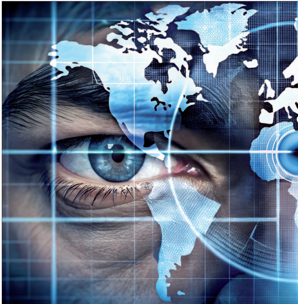
Die Zielfahnder des Bundeskriminalamts fahnden weltweit nach flüchtigen Straftätern

Zielfahndung in Österreich. Beginnend in der Projektphase 2002 wurde die Zielfahndung zu einer erfolgreichen Einheit mit 347 Festnahmen seit ihrer Gründung. Unter den Festgenommenen 320 Männern und 27 Frauen be-