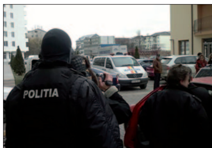
Festnahme eines Bankräubers in Rumänien, der in Österreich mehrere Banken überfallen hatte

bruchs dreieinhalb Tage. Innerhalb von zehn Tagen konnten wir den Mann lokalisieren. Der Flüchtige stand auch im Verdacht, in Paraguay ein deutsches Ehepaar ermordet zu haben. Der Kärntner wurde während seiner Flucht dreimal entführt und erpresst, da bekannt war, dass er international gesucht wurde. Als Reaktion hat er sich völlig abgeschottet und einen lokalen Polizisten zu seinem persönlichen Schutz angestellt. Die Festnahme konnte mit viel diplomatischer Unterstützung der österreichischen Vertretungsbehörden vor Ort erwirkt werden. Als wir sechs Monate später für die Auslieferung wieder nach Paraguay reisten, hat uns der Honorarkonsul auf einen weiteren Österreicher aufmerksam gemacht. Dieser war mit seiner Frau und einer Freundin nach Paraguay gekommen, und die Frau war kurze Zeit später unter verdächtigen Umständen zu Tode gekommen“, berichtet Statmann. „Ein