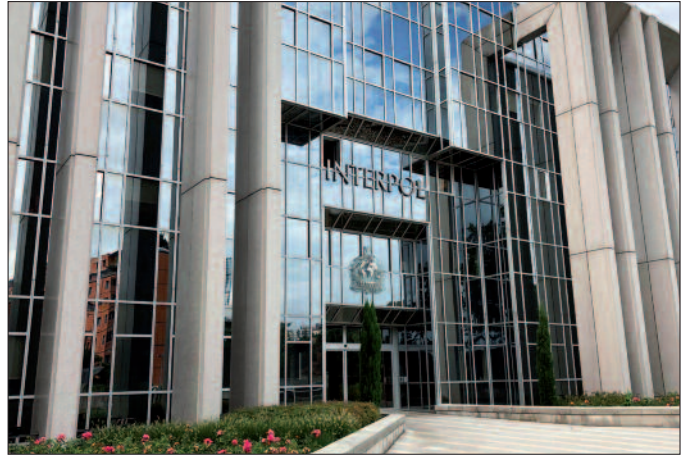
Zentrale des Interpol-Generalsekretariats: Saint Cloud (1966 bis 1989) und Lyon, Frankreich (seit 1989)