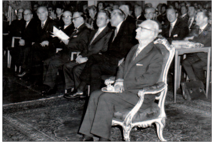
„50 Jahre Interpol“: Jubiläums-Generalversammlung 1973 in Wien; Eröffnungszereemonie mit Bundespräsident Franz Jonas

IGCI Singapur. Im April 2015 wurde der „Interpol Global Complex for Innovation“ (IGCI) in Singapur eröffnet. Kernaufgaben sind Unterstützung bei Ermittlungen zu Cyber-Kriminalität und digitaler Forensik; strategische Trendanalysen zu Innovation, Forschung und digitaler Sicherheit; Aufbau polizeilicher Kapazitäten und Ausbildung; sowie operative Unterstützung mit globaler Reichweite rund um die Uhr. Der IGCI bietet auch Unterstützung bzw. Koordination bei Ermittlungen im asiatischen Raum an.