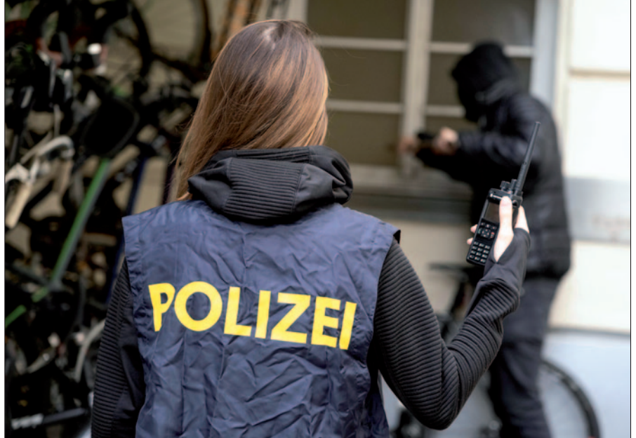
Dämmerungseinbrüche: Die Polizei setzt gegen Einbrecher eigene Ermittlungsgruppen ein und setzt Schwerpunkte beim Streifendienst

Maßnahmen. Die Polizei setzt seit Jahren Maßnahmen ein, um dieses Phänomen zu bekämpfen: Neben vernetzten Analysemethoden und raschen Fahndungsmaßnahmen sind auch eigene Ermittlungsgruppen tätig und es werden Schwerpunkte beim Streifendienst gesetzt. Präventionsbedienstete beraten die Bürgerinnen und Bürger vor Ort.