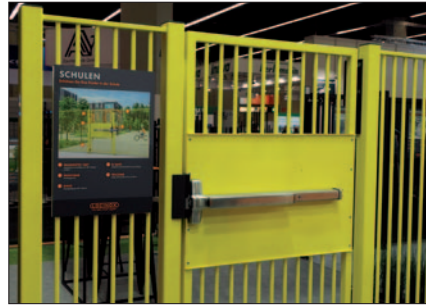
Kindergarten-Tor mit Paniköffner