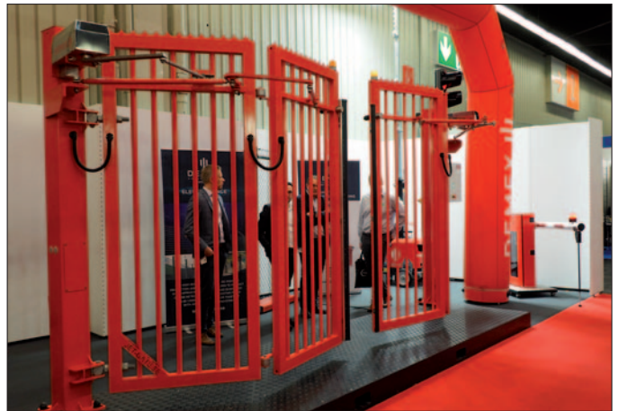
Fachmesse „Perimeter Protection“: Leitstand für das Aufspüren eindringender Drohnen; Falttor.