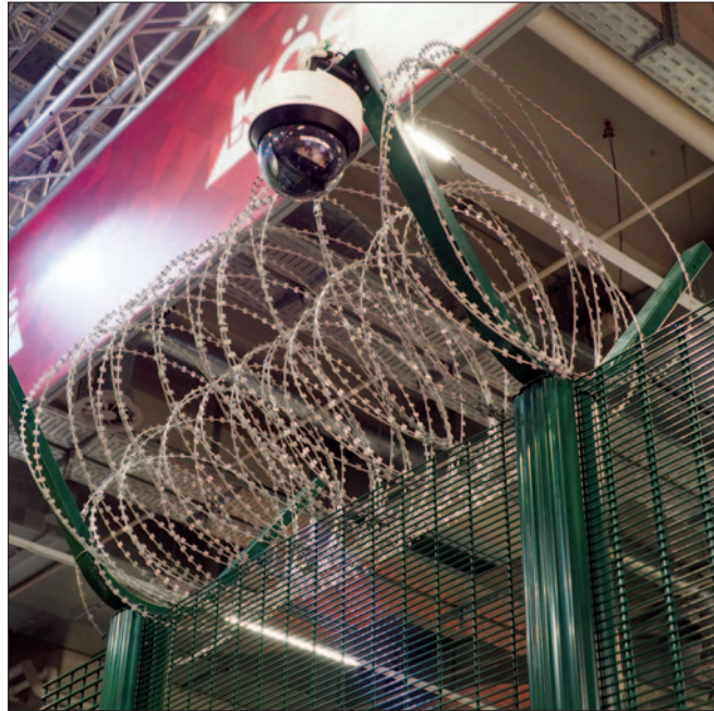
Sicherheitszaun: Mit Metalltechnik (Zäune, Außentore, Schranken, Drehkreuze in Umzäunungen) wurde in Deutschland 2018 ein Umsatz von 567 Millionen Euro erzielt.