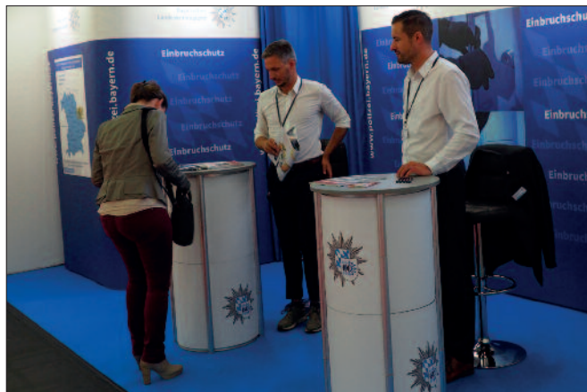
Sicherheits-Expo: Stand des bayerischen Landeskriminalamts.

oder der Akku entfernt wurde. Gleiches gilt für Smart Watches, Diktiergeräte oder Waffen.