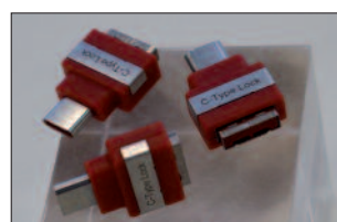
Smartkeeper: Versperren IT-Hardwareschnittstellen.

Mit dem Drohnen-Detektionssystem DIDIT der Tele-