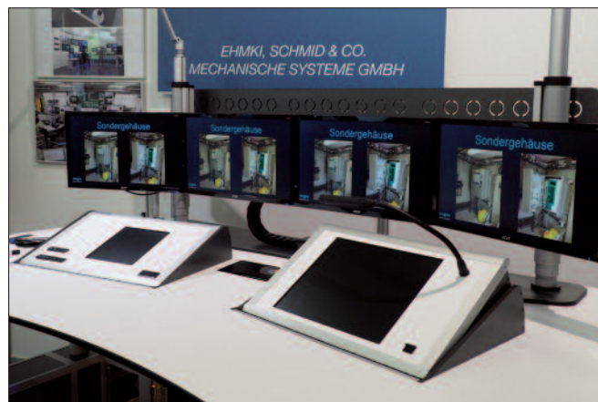
Ergonomisch gestaltete Einsatzzeitstellen.

polizei könne laut Eck beachtliche Erfolge vorweisen. Einer Statistik zufolge wurden vom 1. Juli 2018 bis 20. Juni 2019 bei der Schleierfahndung 3.169 Verstöße gegen das Betäubungsmittelgesetz, 2.008 Urkundendelikte wie Ausweisfälschungen, 903 Waffen- bzw. Sprengstoffdelikte festgestellt sowie 13.201 Fahndungstreffer erzielt. Unter diese fallen mehr als 750 Haftbefehle sowie 111 Personen, die europaweit zur Einreiseverweigerung ausgeschrieben waren. Laut dem Staatssekretär werde weiterhin ein verstärktes Kontrollnetz im Grenzraum aufrechterhalten.