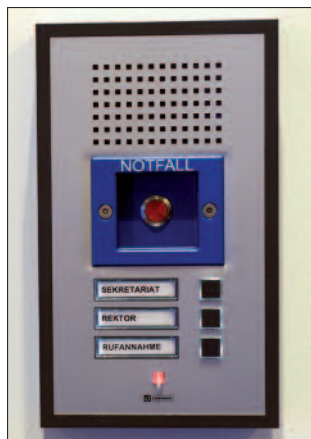
Notrufanlage für Klassenzimmer in Schulen.

Weitere Produkte. Neben den bekannten Torsonden hat die CEIA GmbH ( www.ceia.net ) mit dem MSD-EVO ein mobiles, mit Akku betriebenes Gerät zur Detektion von Mobiltelefonen vorgestellt. Die Sensorik ist als langes, aufrechtstehendes Rohr ausgebildet und erkennt Handys auch dann, wenn sie ausgeschaltet sind