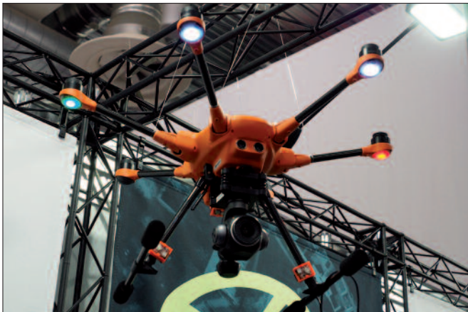
Kabelgebundene Drohne: Kann über die Bodenstation Geräte bis zu einer Leistung von 3 kW mit Strom versorgen.

der Staatssekretär. Auf eine freie Planstelle würden sechs Bewerber kommen.