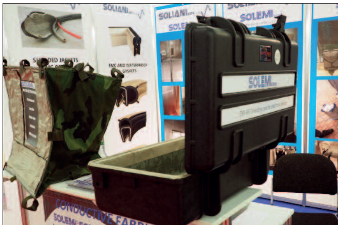
Behälter zur Abschirmung elektromagnetischer Einflüsse.

Schutz von Oberlichtern oder gegen das Durchbrechen von Rigips-Wänden.