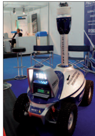
Outdoor-Roboter: autonome Überwachungsfahrten.

Drohrentechnik. Die von der Copting GmbH (www.copting.de) , einem Service-