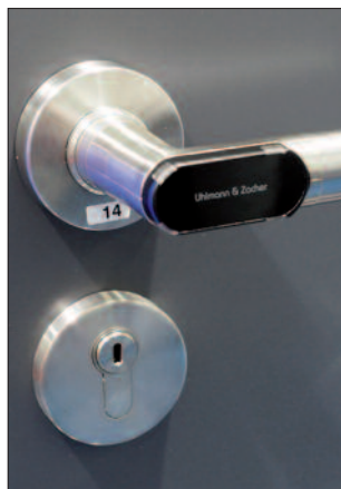
Schließsystem: Elektronisches Schloss im Drücker.