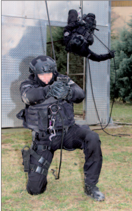
Abseil-Übung: Die Sondereinheit „Tiger“ wurde 1981 gegründet.

ne“ sichern, während die STU in die „heiße Zone“ vordringt. Zur Verstärkung der Polizeipräsenz können daneben auch reguläre Streifenkräfte in „Unterstützungskompanien“ mit spezieller Schutzausrüstung und Bewaffnung zusammengezogen werden. Lediglich in der nordmazedonischen Hauptstadt Skopje operiert die Einheit „Alfa“, die in etwa mit den österreichischen Einsatzgruppen zur Bekämpfung der Straßenkriminalität vergleichbar ist.