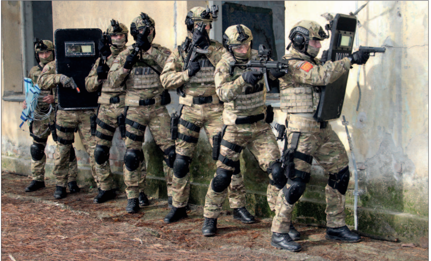
Einsatzübung der Special Task Unit „Tiger“, der Spezialeinheit der Polizei in Nordmazedonien.