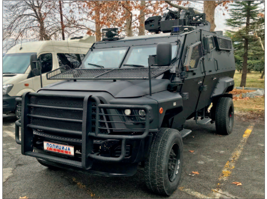
Der Fuhrpark der „Tiger“ umfasst neben Pkws und Transportfahrzeugen unter anderem gepanzerte Fahrzeuge mit ferngesteuerten Geschütztürmen.

Nach einem Jahr gilt ein neues „Tiger“-Mitglied als vollständig einsatzfähig, die kommenden Jahre dienen allerdings dazu, in den verschiedensten Bereichen Erfahrungen zu sammeln und die erforderliche Routine in einem Interventionsteam zu entwickeln. Zweimal pro Jahr müssen sich die STU-Angehörigen einer sportlichen Leistungs-