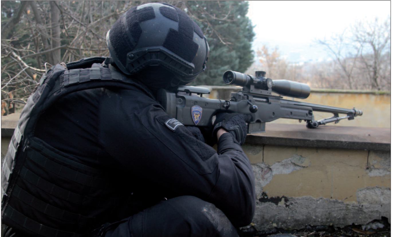
Zu den Waffen der Spezialeinheit „Tiger“ gehören Faustfeuerwaffen, Schnellfeuerwaffen und Präzisionswaffen.

donien an die Schwelle zum Bürgerkrieg geführt hatten, erhielt die albanische Minderheit des Landes durch das Rahmenabkommen von Ohrid mehr politische Rechte: Unter anderem wurde das Recht auf Verwendung von Albanisch neben Mazedonisch als Amtssprache gesetzlich verankert.