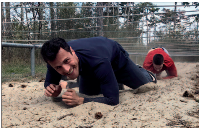
Ausbildung für Auslandseinsätze: Hindernisbahn überwinden.