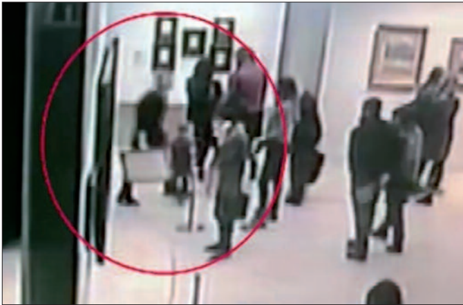
Tretjakow-Galerie: Die Aufnahme einer Kamera zeigt, wie der Dieb mit einem entwendeten Bild die Galerie verlässt.