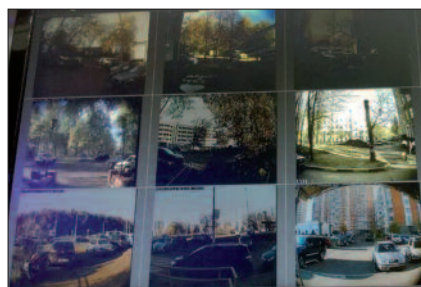
Mit dem Programm „Info-Stadt“ soll die Lebensqualität und das Sicherheitsniveau in Moskau erhöht werden.

Die Kameras helfen der Polizei bei der Aufklärung von Delikten und der Überwachung der Höfe in Moskau. 2017 wurden 3.000 Delikte, darunter auch besonders schwere, mit der Hilfe von Informationen aufgeklärt, die von Videokameras stammen. Auf www.data.mos.ru findet man Informationen über die Videoüberwachungskameras in jeder Straße, jeder Stiege und in jedem Hof. Die Videoaufzeichnungen