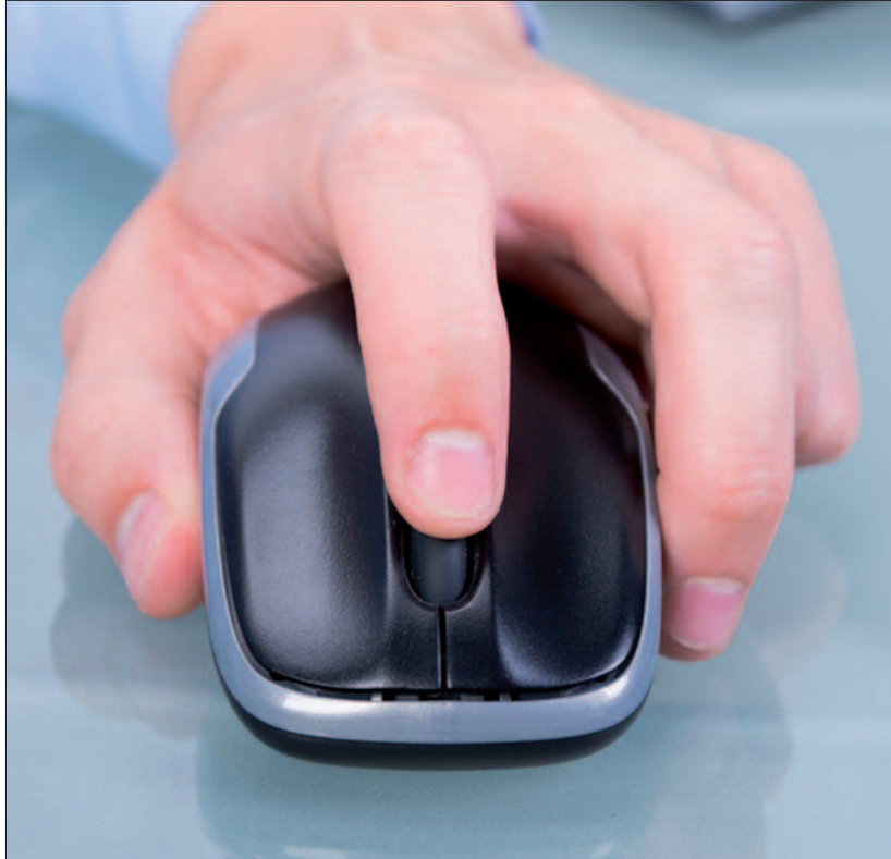
Neues Volksbegehren-System: Unterstützungserklärungen und Eintragungen für Volksbegehren können erstmals auch via Internet getätigt werden.

Neues Volksbegehren-System. Schon jetzt bringt das neue Volksbegehren-gesetz 2018 weitreichende Änderungen mit sich: Bürgerinnen und Bürger mussten bislang ihre Hauptwohnsitz-Gemeinde aufsuchen, wenn sie ein Volksbegehren unterstützen wollten – sowohl bei der Sammlung von Unterschriften, um überhaupt ein Volksbegehren starten zu können („Einleitungsverfahren“), als auch in der späteren Phase des – meist österreichweit durchgeführten – achttägigen „Eintragungsverfahrens“. Nun können Wahlberechtigte in jede Gemeinde gehen,