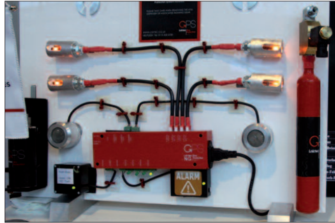
Symposium Sicherheit Erste Group: Schematischer Aufbau einer Anlage zum Schutz von Bankomaten vor Gassprengung.

Wenn die Algorithmen sauber programmiert wurden, kann die hochwertige Verschlüsselung nicht „geknackt“ werden. Allenfalls eröffnen Fehler in der Programmierung Möglichkeiten dazu. Ferner wird psychologischer Druck aufgebaut: Ein ablaufender Sekundenticker zeigt an, wie viel Zeit zur Lösegeldzahlung noch zur Verfügung steht, bis die Dateien unwiederbringlich gelöscht oder verschlüsselt werden. Oder es wird schrittweise Datei um Datei gelöscht und dies angezeigt. Ob bei Zahlung des gefor-