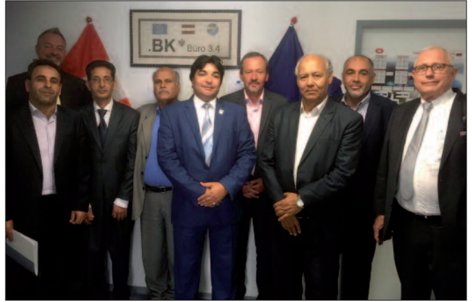
Besuch einer libyschen Delegation im Joint Operational Office (JOO) des Bundeskriminalamts in Wien.

meinsame Planung, der Bau und die Einrichtung einer großen Polizeistation in Tripolis. In dieser Polizeistation sollen ungefähr 100 Beamte arbeiten. Dort sollen etwa Opfer von Verbrechen menschenrechtskonform betreut werden können und die Anhaltzellen sollen internationalen Standards entsprechen.