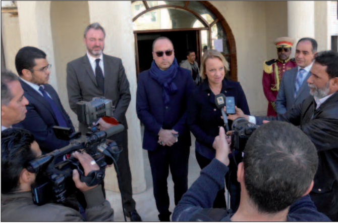
Pressekonzferenz nach einem Treffen mit Vertretern des libyschen Justizministeriums in Tripolis.