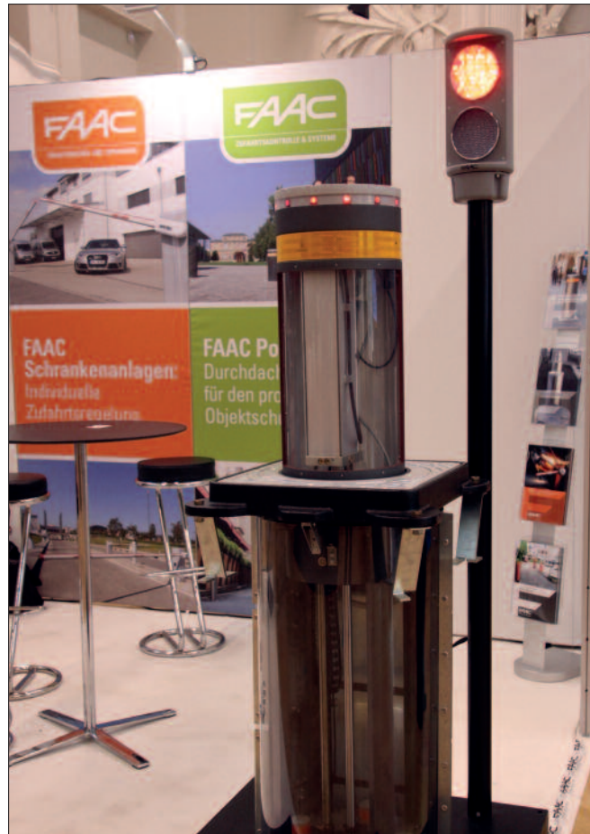
Das österreichische Unternehmen FAAC präsentierte auf der „Protekt 2017“ in Leipzig Produkte für Zufahrtssicherheit.

Nach Vorarbeiten im Rahmen einer öffentlich-privaten Partnerschaft von Betreibern kritischer Infrastruktur (KRITIS) und dem Bund ( UP KRITIS; www.upkritis.de ), ist am 25. Juli 2015 in Deutschland das Gesetz zur Erhöhung der Sicherheit informationstechnischer Sys-