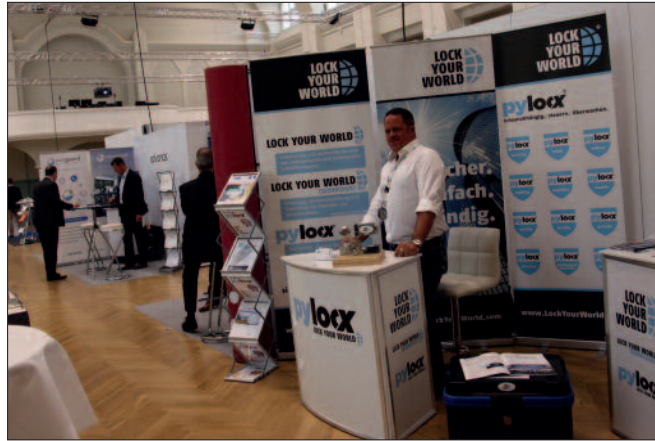
Fachmesse „Protekt 2017“: 29 Aussteller von Sicherheitsprodukten, über 200 Kongress-Besucher.

Sogar Tötungshandlungen über das Tatmittel Internet könnten nicht mehr ausgeschlossen werden, etwa über die Fernwartung von medizinischen Geräten (Be-