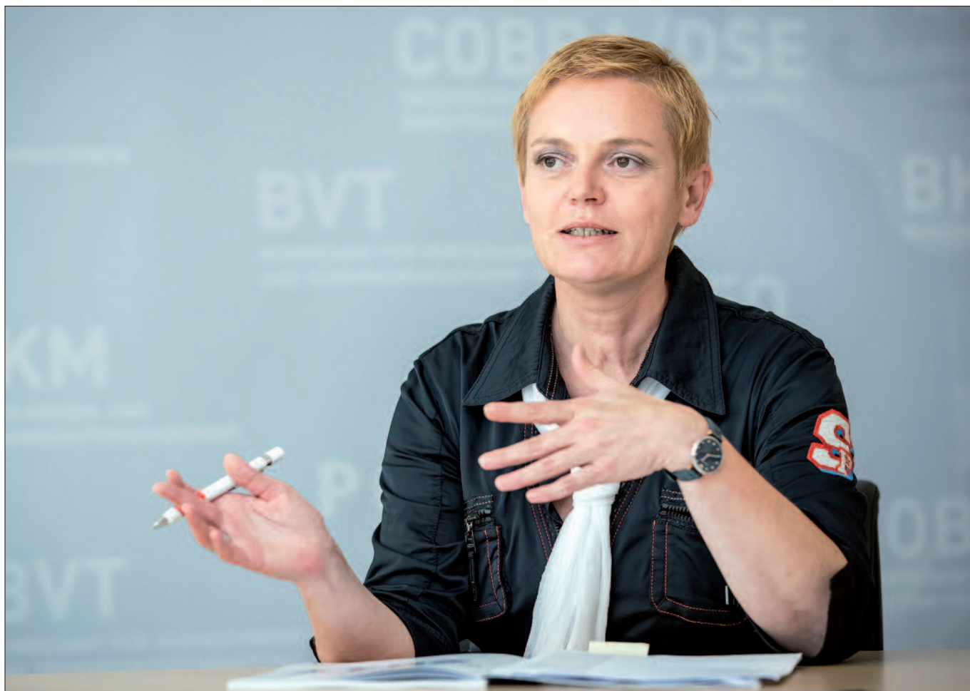
Generaldirektorin für die öffentliche Sicherheit Michaela Kardeis: „Mein Ziel ist es, das Vertrauen der Menschen in die Polizei nicht nur zu erhalten, sondern noch zu steigern.“

Ranking man sich ansieht: Wir sind immer sehr weit oben. Eine Stärke der Polizei ist, dass man sie in der Bevölkerung kennt, dass man weiß, was sie tut, und dass man sich auf sie verlassen kann. Aber dieses Vertrauen zu haben, bedeutet nicht, dass wir uns auf diesen Lorbeeren ausruhen könnten.