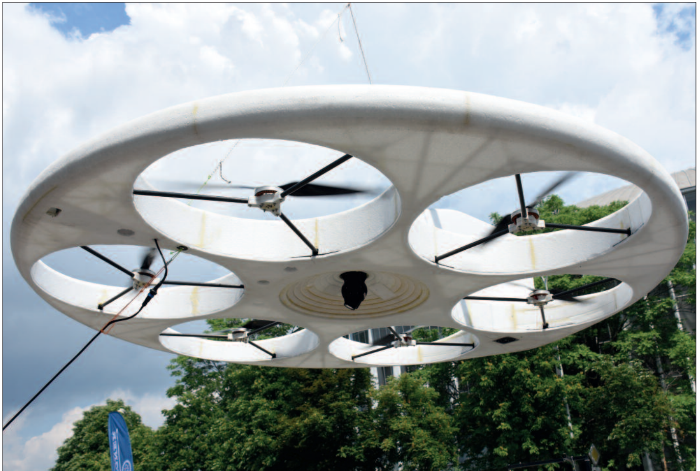
Unbemannte Fluggeräte: Der Betrieb von Drohnen in Österreich wurde 2014 mit einer Novelle des Luftfahrtgesetzes geregelt.