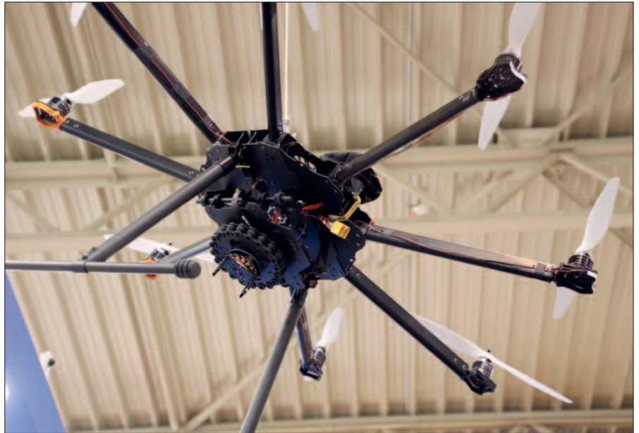
Drohnen können auch Sprengstoffe, Giftstoffe und illegale Drogen absetzen.

„Es geht bei den Rockerclubs nicht mehr um das Gefühl der Freiheit, son-