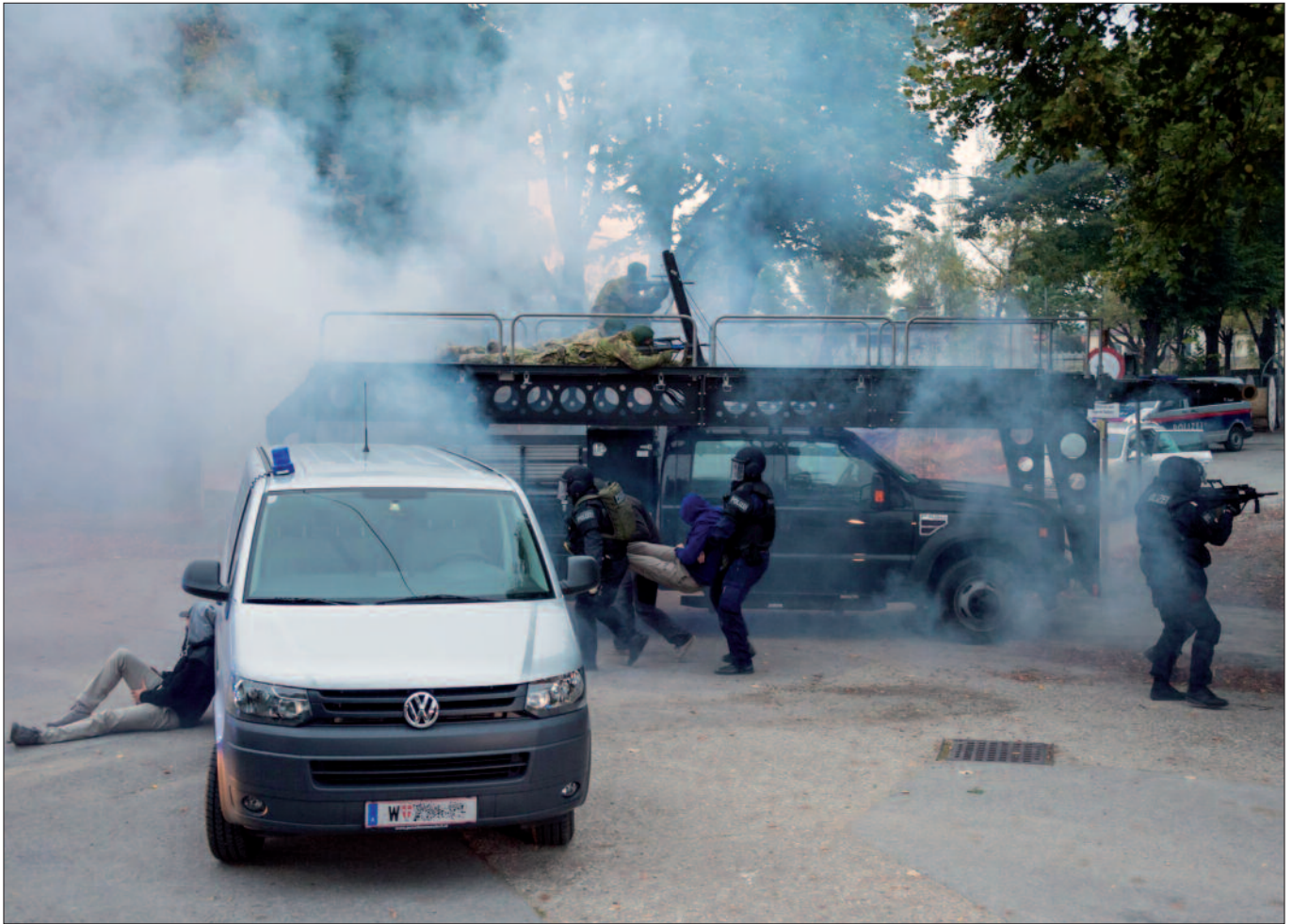
Antiterrorübung mit Verletztenbergung im Oktober 2016 in Wien: Das Umfeld muss ständig beobachtet werden.