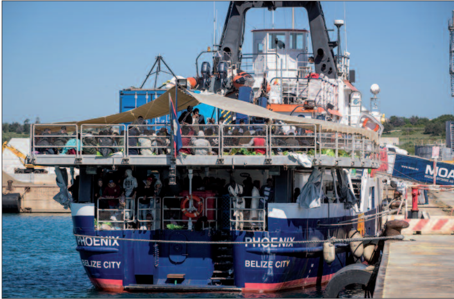
Sizilien: Bis zu 500 Migranten pro Schiff werden von privaten Hilfsorganisationen auf die italienische Mittelmeerinsel gebracht.