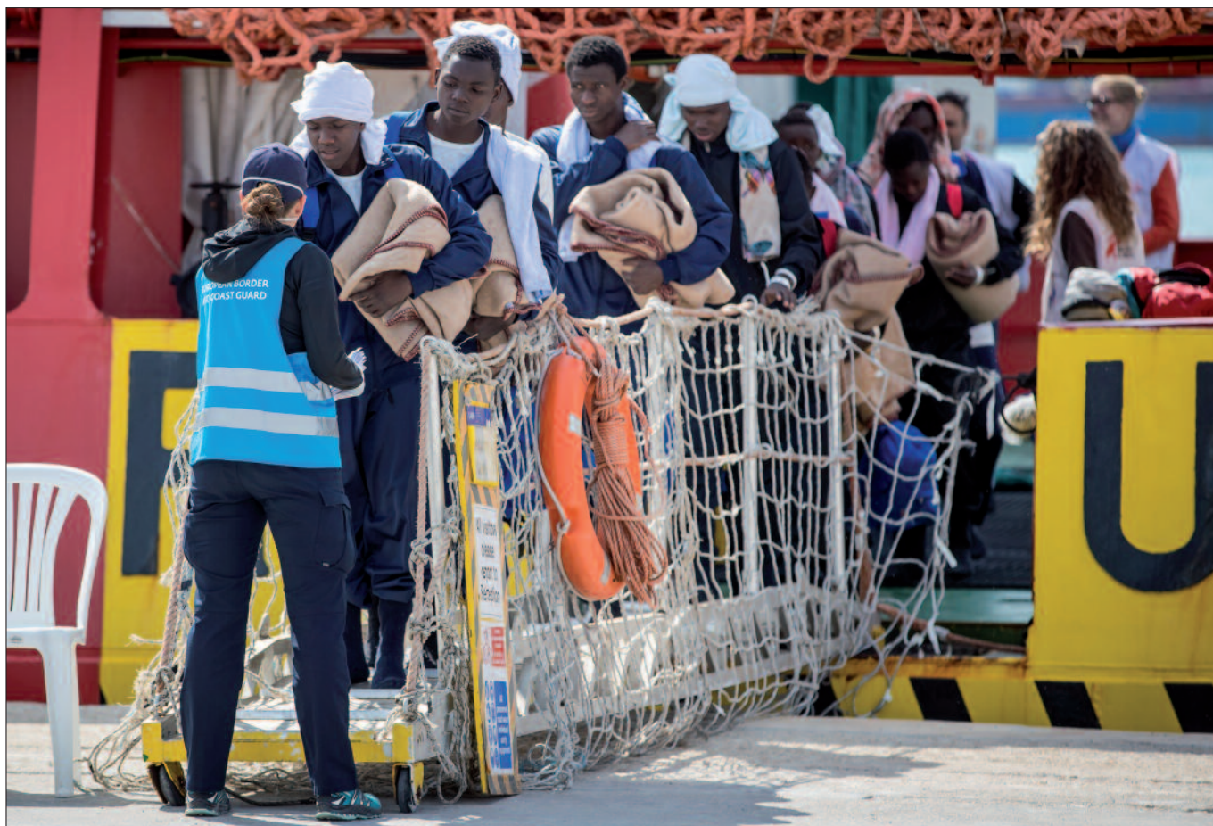
Aufgabe der Frontex-Polizisten auf Sizilien ist die Identifizierung und Registrierung ankommender Migranten.

bichler als Präventionsbeamtin tätig. „Wir haben die meisten Betretungsverbote wegen Gewalt in der Familie in der Stadt Salzburg.“