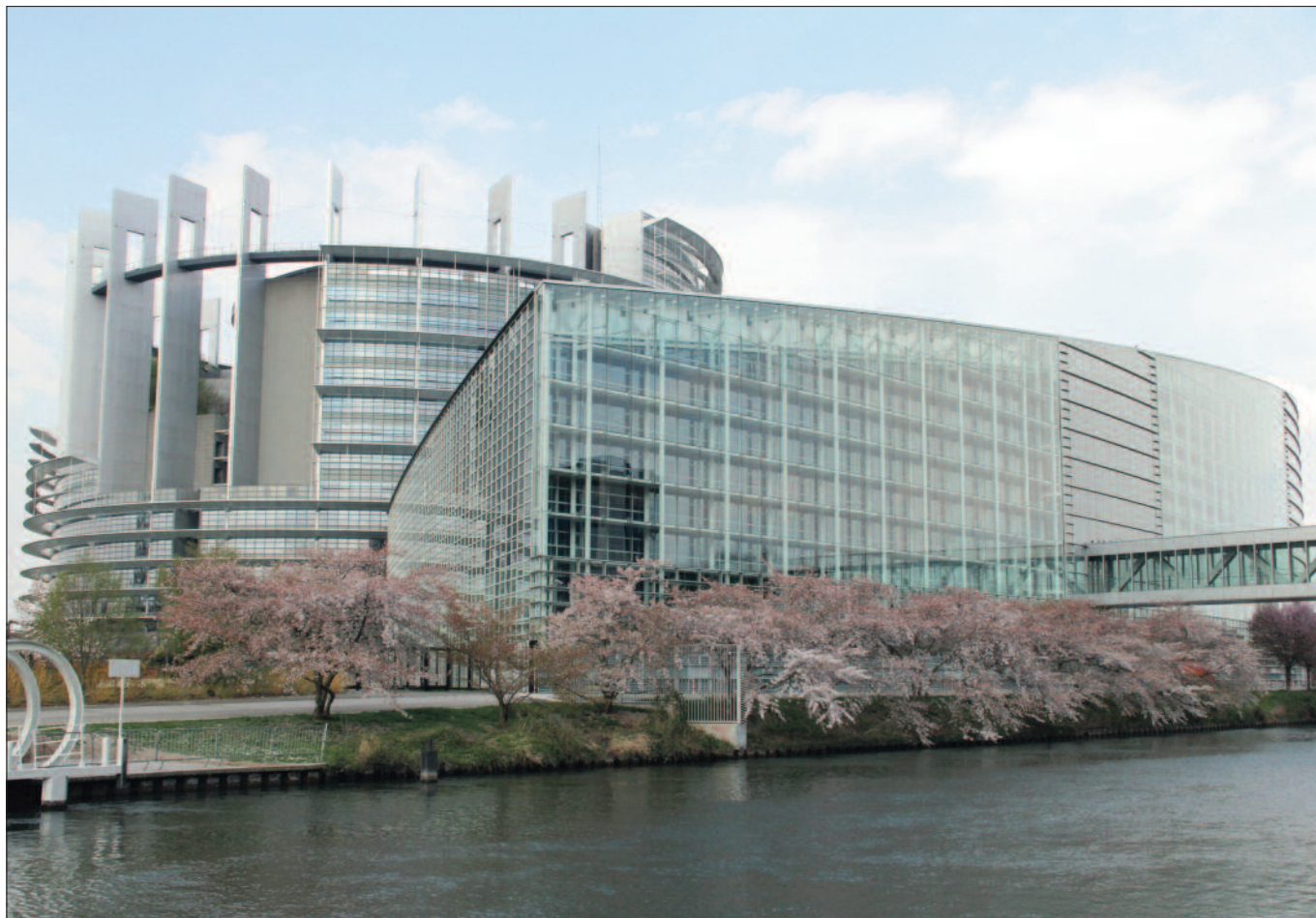
Europäisches Parlament in Straßburg: Das Post-Stockholm-Programm ist auch geprägt von der derzeitigen weltpolitischen Lage.

der Thematik in den JI-Gremien und im JI-Rat ein. Auch mit Unterstützung anderer Mitgliedstaaten (u. a. Forum-Salzburg-Partner) gelang es folglich, in den strategischen Ausschüssen CATS ( Committee of Article Thirty Six ), CO-SI ( Comité de Sécurité Intérieure ) und SCIFA ( Strategic Committee on Immigration, Frontiers and Asylum ) sowie im Ausschuss für Zivilrecht die Abhaltung vertiefter Diskussionen anzuregen. Bei diesen Diskussionsrunden zeigte sich, dass die angespannte wirtschaftliche Lage entscheidenden Einfluss auf die Schwerpunktsetzung hat. Eine bestmögliche Nutzung der knappen Ressourcen und der vorhandenen Strukturen – wie der Agenturen der EU – ist daher für das Post-Stockholm-Programm von besonderer Bedeutung.