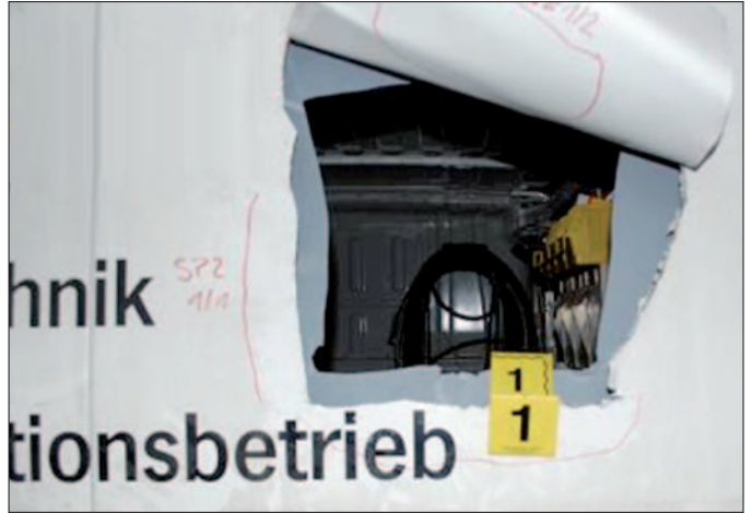
Kfz-Einbruch: Die Täter schnitten die Hecktüre eines Firmenautos auf, um daraus Werkzeug zu stehlen.