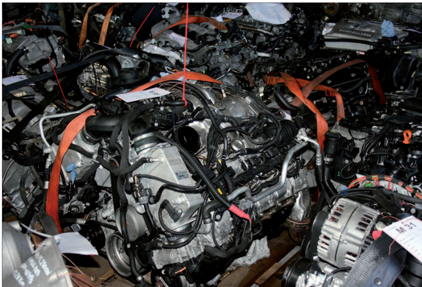
Gestohlene Motoren und Getriebe: Von der Polizei in einer Lagerhalle in der Steiermark sichergestellt.

die bei Kfz-Händlern stehen oder in Auslieferungslagern von Generalimporteuren. 2012 registrierte die Polizei 439 Airbag-Diebstähle, 2013 waren es 679. Im ersten Halbjahr 2014 wurden 300 Airbagdiebstähle registriert.