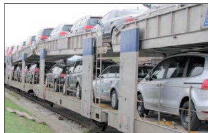
Eine Reihe von Navigationsgeräten wurden aus Autos auf Zügen gestohlen.

Der Verdächtige setzte sich auf die Philippinen ab und zog dort trotz einer Sperre bei E-Bay erneut einen Handel mit gestohlenen Autoteilen auf. Er soll