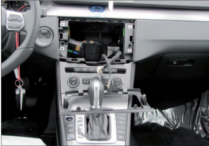
Etwa vier Minuten braucht ein geübter Dieb, um ein Navigationssystem aus einem Auto zu stehlen.