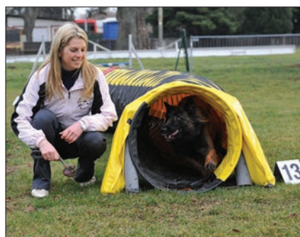
Der Tunnel gehört zu den etwa 20 Hindernissen bei einem Agility-Bewerb.