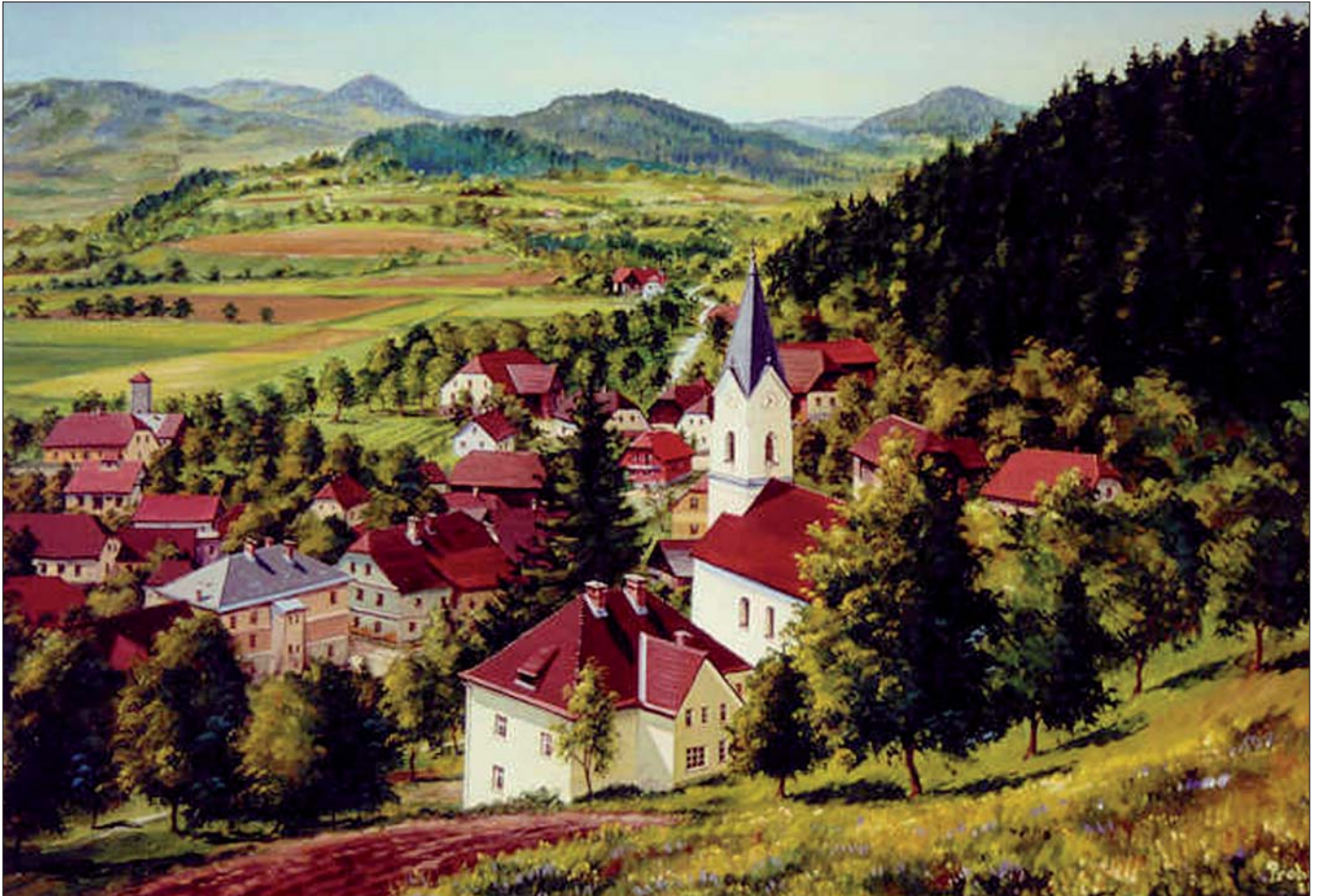
Ettendorf im Lavanttal: Der Künstler hält Landschaften, Häuser und Kirchen seiner Heimat auf der Leinwand fest.