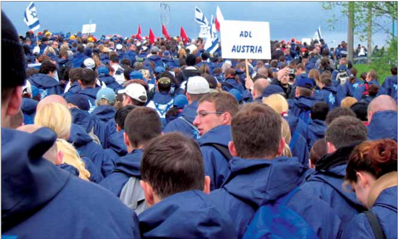
March of the Living: Teilnehmer aus Österreich.