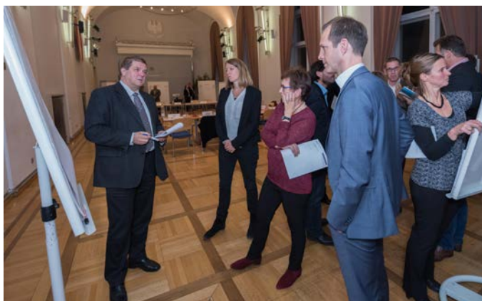
ZDG-Mitglieder in Diskussion

Dieser Prozess gewährleistet eine gleichberechtigte Arbeit auf Augenhöhe, einen gleichbleibenden und nachvollziehbaren Arbeitsprozess, die Möglichkeit der Mitarbeit sowie Transparenz und die Nachhaltigkeit von Entscheidungen.