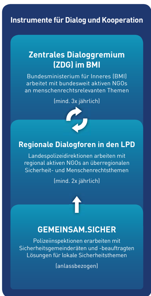
Abbildung 2: Polizei im Dialog

Ziel des Dialogprozesses ist es einerseits, die Qualität der Arbeit der Exekutive durch den Beitrag von Vertreterinnen und Vertretern der Zivilgesellschaft weiterzuentwickeln und andererseits die gesellschaftliche Akzeptanz von Entscheidungen der Exekutive vorzubereiten bzw. im Umfeld zu kommunizieren. Prinzip ist das partnerschaftliche und kooperative Miteinander.