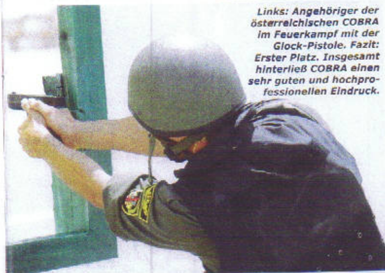
Links: Angehöriger der österreichischen COBRA im Feuerkampf mit der Glock-Pistole. Fazit: Erster Platz. Insgesamt hinterließ COBRA einen sehr guten und hochprofessionellen Eindruck.

Ganze Seite: Jordanien hat in den letzten Jahren unter König Abdullah II sehr viel für seine Sondereinheiten getan. Nicht nur der Bau des KASOTC geht auf seinen Namen, sondern auch die Ausbildung und Ausrüstung seiner Truppe nach westlichen Standards.