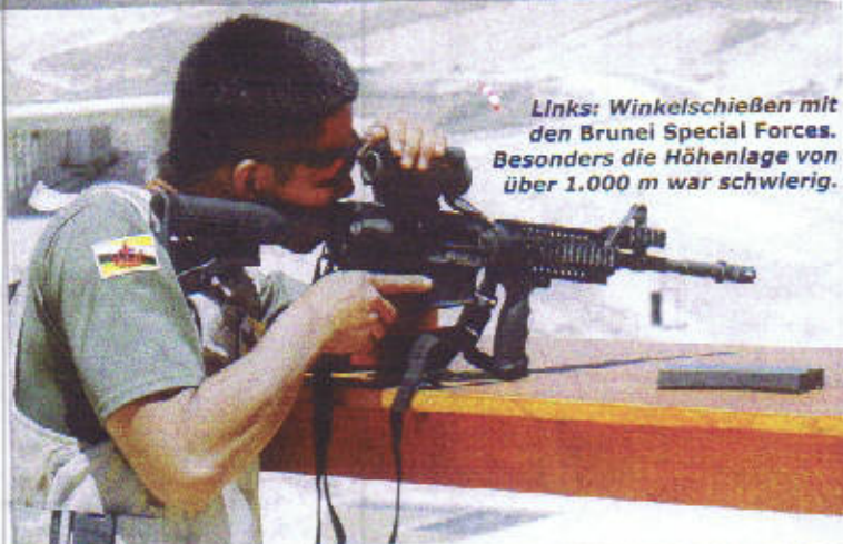
Links: Winkelschießen mit den Brunei Special Forces. Besonders die Höhenlage von über 1.000 m war schwierig.