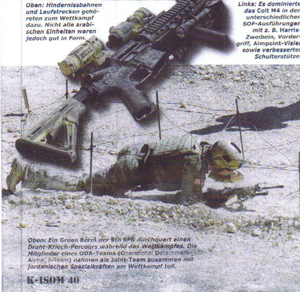
Oben: Ein Green Beret der 5th SFG durchquert einen Draht-Kriech-Perours während des Wettkampfes. Die Mitglieder eines ODA-Teams (Operational Detachment Alpha, A-Team) nahmen als Joint-Team zusammen mit jordanischen Spezialkräften am Wettkampf teil.