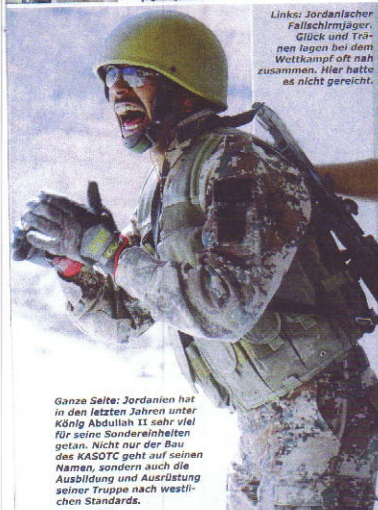
Links: Jordanischer Fallschirmjäger. Glück und Tränen lagen bei dem Wettkampf oft nah zusammen. Hier hatte es nicht gereicht.

Ganze Seite: Jordanien hat in den letzten Jahren unter König Abdullah II sehr viel für seine Sondereinheiten getan. Nicht nur der Bau des KASOTC geht auf seinen Namen, sondern auch die Ausbildung und Ausrüstung seiner Truppe nach westlichen Standards.