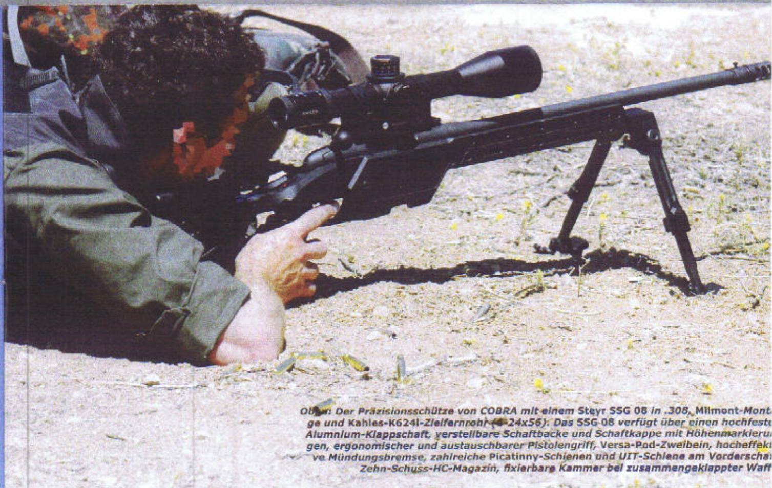
Oben: Der Präzisionsschütze von COBRA mit einem Steyr SSG 08 in .308, Milmont-Montage und Kahles-K624I-Zielfernrohr (4-24x56). Das SSG 08 verfügt über einen hochfesten Aluminium-Klappschaft, verstellbare Schafthacke und Schafthacke mit Höhenmarkierungen, ergonomischer und austauschbarer Pistolengriff, Versa-Pod-Zweibein, hocheffektive Mündungsbremse, zahlreiche Picatinny-Schienen und UIT-Schiene am Vorderschaft, Zehn-Schuss-HC-Magazin, fixierbare Kammer bei zusammengeklappter Waffe