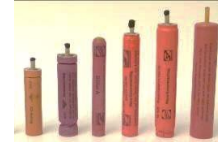
Knallkörper ( nur mit Schwarzpulver)