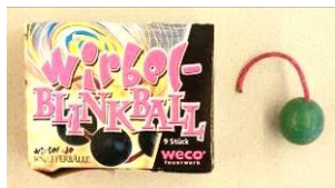
Rauch- und Blitzkugeln