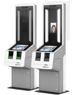
Self-Service-System @secunet Security Networks AG