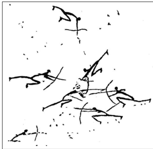
Abb. 2: Felsmalerei eines Gefechtes von Bogenschützen (spätes Mesolithikum) – Cueva del Roure, Morella la Vella, Valencia, Spanien

In der Antike waren die Möglichkeiten der Wirkungssteigerung von Pfeilen durch Gifte vermutlich bereits weitgehend bekannt. Die zweite Arbeit des Herakles, das Töten der Hydra, endete damit, dass erakles seine Pfeile in die Galle der Hydra tauchte. Dadurch sollten diese schon bei kleinsten Verletzungen tödlich wirken. Diese Geschichte ist offensichtlich kein Tatsachenbericht, sie zeigt aber, dass das Vergiften von Pfeilen für die Griechen (und ebenso ihre Gegner) kein ungewöhnliches Verfahren war. Darauf deutet ebenfalls, dass der griechische Begriff „toxikon pharmakon“, von dem sich der heutige Begriff Toxikologie herleitet, Pfeilgift bedeutet (toxikon = zum Bogen gehörig). Aristoteles berichtet vom Pfeilgift der Skythen – im Wesentlichen ein