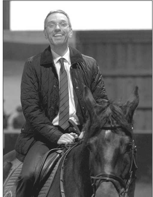
Innenminister Herbert Kickl auf dem Rücken eines Münchner Polizeipferdes (14. Februar 2018)

sich Polizeireiter auch bei polizeilichen Großeinsätzen und zu Suchmaßnahmen nach vermissten oder hilflosen Personen sowie flüchtigen Straftätern einsetzen. Durch die hohe Mobilität und respektvolle Größe erzielen sie eine präventive und deeskalierende Wirkung und ergänzen die bestehenden polizeilichen Einsatzmittel. (...) Die erhöhte Sitzposition ermöglicht eine bessere Übersicht und Wahrnehmung von Sachverhalten. Gleichzeitig sind Pferde schnell und ausdauernd, also für längere Streifen gut geeignet.“ Polizeipferde, so Kickl, führen „zu einer verbesserten Wahrnehmung der Polizei“, tragen „zur Verbesserung des subjektiven Sicherheitsgefühls“ bei, „sind eine Maßnahme von vielen, um den direkten Kontakt zur Bevölkerung herzustellen und auf Probleme reagieren zu können. Community Policing profitiert vom Einsatz der Dienstpferde, da sich auf Grund der Tiere oft Gespräche zwischen Bürgerinnen und Bürgern und Polizeibeamtinnen und Polizeibeamten ergeben. So gesehen“, meinte Kickl, „wird bei jeder Streife durch Angehörige der