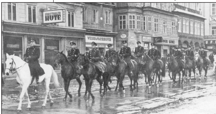
Abschied der berittenen Polizei in Linz (10. Dezember 1950)