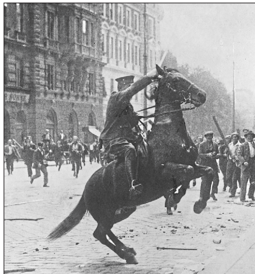
Einsatz der berittenen Polizei (15. Juli 1927)