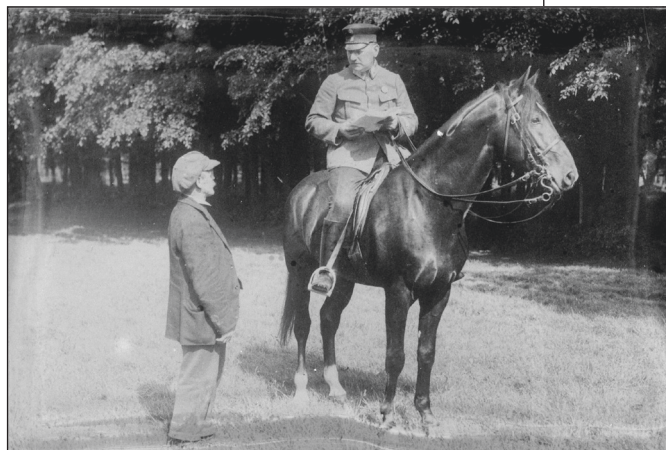
Berittene Polizei in der Ersten Republik