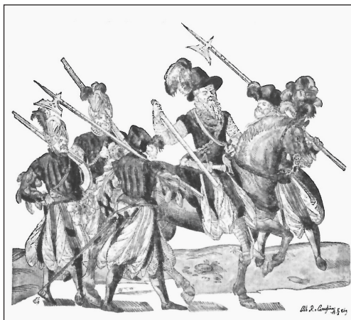
Wiens Bürgermeister Hanns von Thau als Oberst eines Bürgerregiments (1571)

1618 wurde die ein halbes Jahrhundert zuvor gegründete Wiener Stadtguardia aufgerüstet und personell deutlich verstärkt. Dabei wurden dem Wachkörper erstmals Pferde zugeteilt, doch die berittene Abteilung war kostspielig und wurde nach wenigen Jahren wieder aufgelöst. 7 Zudem handelte es sich um den Einsatz von Pferden in einer militärischen Formation, womit von einer polizeilichen Reiterstaffel keine Rede sein konnte. Dies umso mehr, als es noch gar keine Struktur für ein geregeltes Polizeiwesen gab, welches mit klaren Zuständigkeiten und entsprechenden Mitteln ausgestattet war. Bei allen Erfolgen, die trotz der unübersichtlichen Situation erzielt werden konnten, prägten bis zum 18. Jahrhundert mangelnde Kooperation, unzureichende Kompetenzabgrenzungen, Zwistigkeiten und Auseinandersetzungen zwischen den ver-