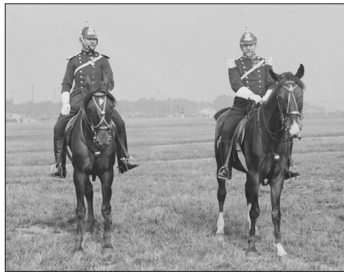
Berittene Sicherheitswache rund um die Jahrhundertwende (19./20. Jh.)

Die Berittenen waren zu einer fest verankerten Größe innerhalb der österreichischen Polizei geworden. Eine weitere Verstärkung der Reiterstaffeln wurde durch den Ersten Weltkrieg verhindert. Die Kriegsjahre zehrten an der Substanz, die Armee benötigte jede Unterstützung, Angehörige der berittenen Polizei wurden zum Kriegsdienst herangezogen, die verbliebenen Pferde litten an Futtermangel und waren nur eingeschränkt diensttauglich. Am Ende des Krieges standen der Wiener Sicherheitswache immer noch 274 Pferde zur Verfügung, doch viele davon waren alt und gesundheitlich in einem sehr schlechten Zustand. 21 In den Wirren der Nachkriegszeit und mit dem Untergang