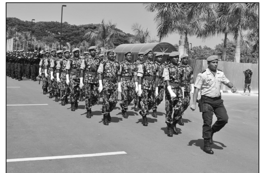
Abb. 4: Brasilianische UN-Polizeikräfte