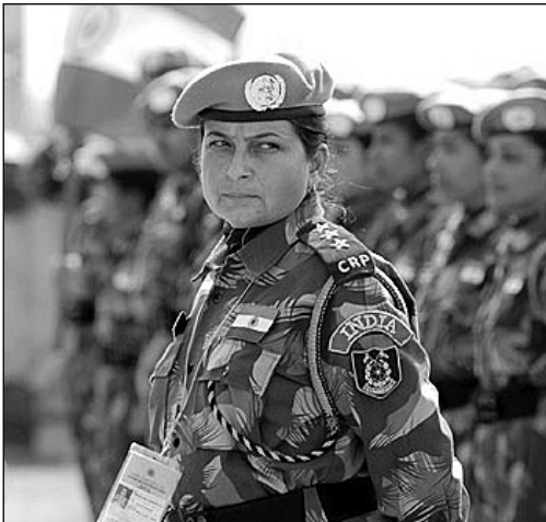
Abb. 3: Indische UN-Polizistin