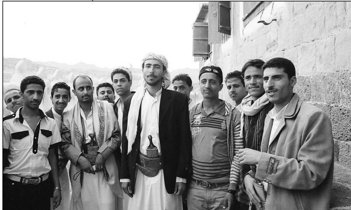
Ausflug zum Imam Yahya Palace

größte und beeindruckendste der ganzen Arabischen Halbinsel“. 20