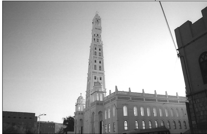
al-Madhab Moschee in Tarim

gen der muslimischen Pflichten – und damit ist auch die Pflicht des jihad gemeint – zu den eigenen machen, bleibt abzuwarten. Angesichts der aktuellen politischen, ökonomischen und sozialen Situation im Lande sollte jedoch diese Wartezeit vielleicht nicht überdimensional ausgedehnt werden.