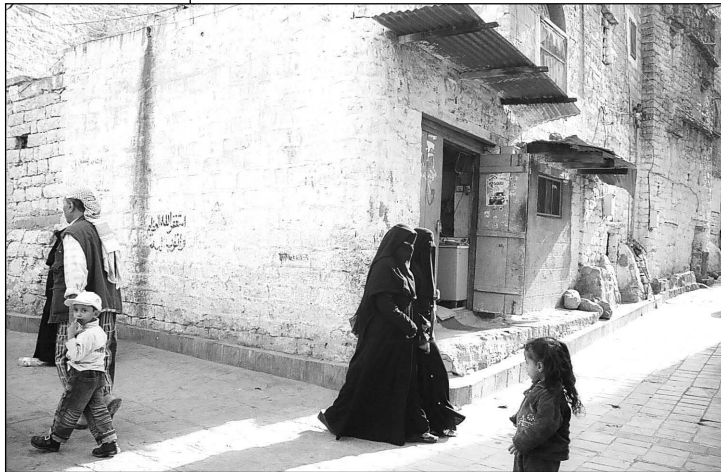
Straße in Ibb

rungen. Doch die junge Generation möchte nicht warten und traut sich einiges zu: „Frauen haben (...) eine bessere Bildung als Männer und Frauen arbeiten wirklich hart. Sie tun mehr als die Männer, denn in der Familie sind sie es, die einkaufen, arbeiten, sich um den Haushalt kümmern und die Kinder erziehen. Das Problem ist: Unsere Gesellschaft fördert die Frauen nicht so, wie wir uns das wünschen. Aber jemenitische Frauen sind stark und bereit, für ihre Rechte zu kämpfen. Frauen im Jemen sind Mann und Frau zugleich.“ 42