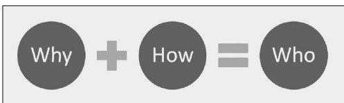
Abb. 2: Ermittlungsformel nach John Douglas: Warum + Wie = Wer

demnach als Bezugssystem herangezogen (vgl. Vick 2006, 8). Um den Ablauf der Handlung Zug um Zug zu rekonstruieren, greift die Fallanalyse – ausgehend von einer im Auftrag des deutschen Bundeskriminalamtes im Jahre 1985 in Auftrag gegebenen Studie – auf eine Methode aus der Qualitativen Sozialforschung, der so genannten Objektiven Hermeneutik von Ulrich Oevermann zurück. Die Hermeneutik als „Lehre des Verstehens“ versucht menschliche Verhaltensäußerungen (z.B. Reden, Texte, Musik, Malerei, Handlungen usw.) zu verstehen und zu interpretieren (vgl. Hoffmann/Musolff 2000, 229). Im Falle einer Straftat führte Ulrich Oevermann den Begriff des „Spurentextes“ ein. Aus kriminalistischer Sicht bedeutet das, den am Tatort wahrnehmbaren Spurentext in eine Handlungssequenz zu zerlegen und dann als solche zu rekonstruieren (vgl. Müller 2006a, 16). Die als Sequenzanalyse bezeichnete Methode der Objektiven Hermeneutik beruht auf folgendem Prinzip: