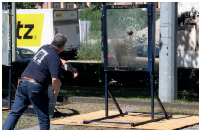
Tests an Glasscheiben, die auf der Innenseite mit Folien beschichtet sind, die die Bruchstücke zusammenhalten.

Die Ausrüstung der bayerischen Polizei mit modernster Ausrüstung und Technik wird vorangetrieben. Jeder Streifenwagen wird mit zwei ballistischen Helmen sowie mit bis zu den Oberschenkeln reichenden Überwürfen ausgestattet, die auch bei Beschuss mit Kalashnikov-Sturmgewehren Schutz bieten. Die polizeiliche Videoüberwachung soll ausgebaut werden, allerdings nicht flächendeckend wie in London, sondern mit Fokussierung auf Schwerpunkte wie etwa die U- und S-Bahnbereiche in München oder an