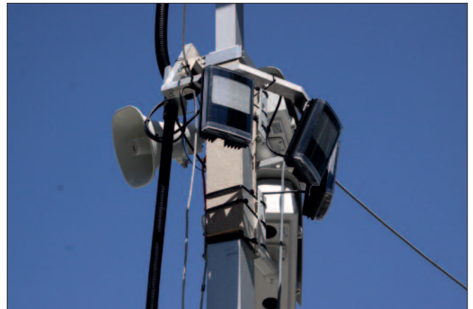
Videokameras mit hoher Auflösung: Zur Überwachung größerer Flächen wie etwa Stadien.

Die Firma ELOCK2 ( www.elock2.de ) stellt digitale Zylinderschlösser her mit einer patentierten mechanischen Selbstverriegelung der Falle. Fällt die Tür ins Schloss, ist sie über die Falle verriegelt. Von außen kann sie nur mit dem berechtigten Transponder, von innen aber, trotz Versperung, durch Betätigen des