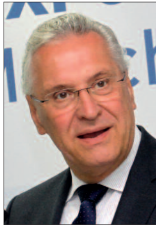
Joachim Herrmann: „Es lohnt sich, mehr für die Sicherheit zu tun, denn Einbrecher scheitern in etwa der Hälfte der Fälle.“

„Einbrecher kommen nur nachts und da bin ich ja zu Hause“ – stimmt auch nur bedingt. Nach einem Einbruchsreport der Versicherungswirtschaft finden 71 Prozent der Wohnungsein-