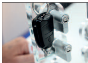
Elektronisches Schließ- und Zutrittskontrollsystem.

Orten mit besonderer Kriminalitätsbelastung (Drogenhandel, Raubüberfälle). Bei entsprechender Ausreifung der Systeme für Gesichtserkennung sollen auch diese eingesetzt werden. Datenschutzrechtlich sei dies einer Fahndung mit Fahndungsfotos gleichzusetzen, unter Nutzung der neuen