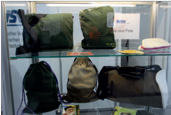
Designertaschen: Hergestellt aus ausgemusterten Uniformen der bayerischen Polizei.

Wirtschaft gegründet und umfasst derzeit 170 Mitgliedsfirmen. Der BVSW ist eingebettet in den Dachverband ASW, der Allianz für Sicherheit in der Wirtschaft. Er bietet Leistungen als Interessenvertretung an, wie juristische Beratung und Mitwirkung bei Gesetzen.