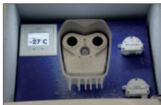
Sicherheitsprodukte: Fallenverriegelung, Überwachungskamera im Kälte-test, Hybrid-Zylinderschloss.

Orten mit besonderer Kriminalitätsbelastung (Drogenhandel, Raubüberfälle). Bei entsprechender Ausreifung der Systeme für Gesichtserkennung sollen auch diese eingesetzt werden. Datenschutzrechtlich sei dies einer Fahndung mit Fahndungsfotos gleichzusetzen, unter Nutzung der neuen