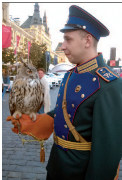
Dienst-Uhu „Filja“: Streifenflüge in der Nacht über den Kreml.

Repräsentative Aufgaben. Zusätzlich zur Bewahrung der „Lufthoheit“