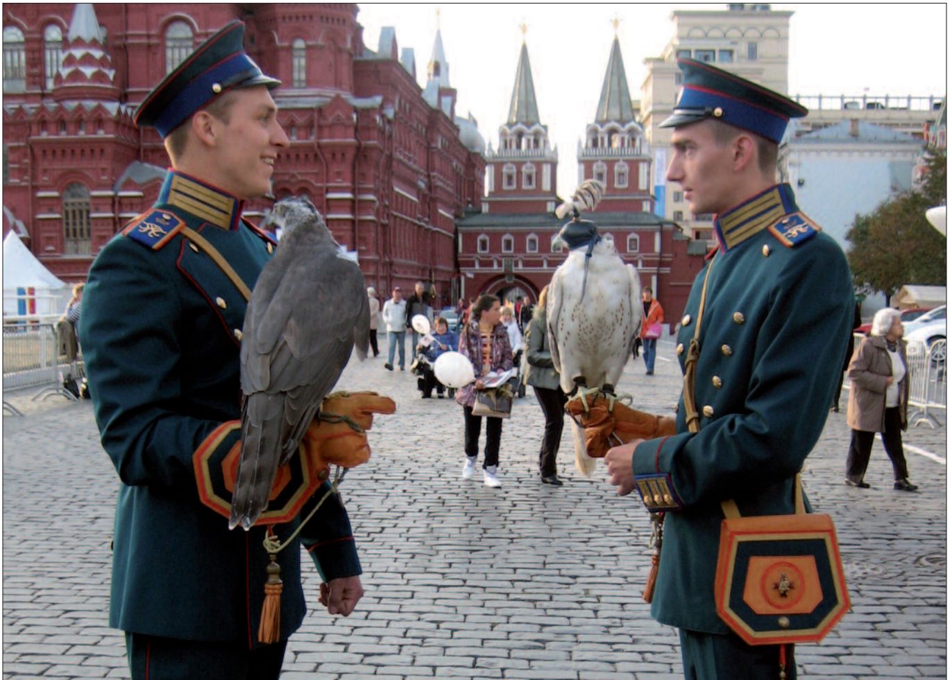
Dienst-Habichte des „Ornithologisches Dienstes“: Krähen- und Rabenabwehr im Kreml.