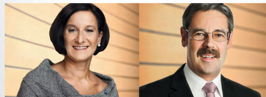
Bundesministerin Mag. Johanna Mikl-Leitner, BM.I