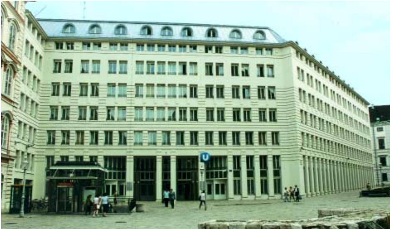
Ein Großteil der Abteilungen und Referate der Sektion V befindet sich im Amtsgebäude Minoritenplatz.

geordneten Behörden beauftragt und hat die Aufgabe, eine gesetzmäßige Vollziehung sowie eine sparsame, zweckmäßige und wirtschaftliche Gebarung sicherzustellen.