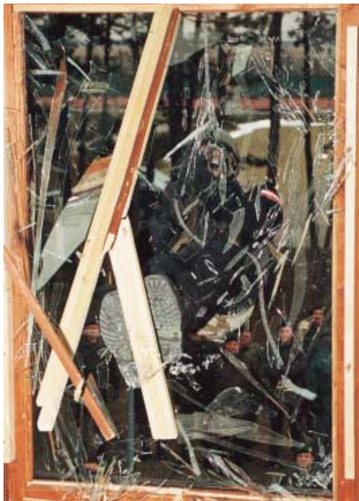
Beamte des Gendarmerieeinsatzkommandos bei einer Übung.

Einsatzgruppe zur Bekämpfung der Suchtgiftkriminalität (EBS) – Die EBS ist die älteste Sondereinheit des Innenministeriums im kriminalpolizeilichen Bereich. Die verdeckten Ermittler arbeiten im gesamten Bundesgebiet, da herkömmliche Erhebungsmethoden wegen der Eigenart der Suchtmittelkriminalität und der meist konspirativen Vorgangsweise der Täter nur bedingt zielführend sind.