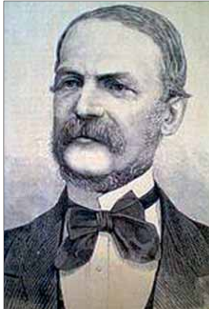
Polizeichef Anton Ritter von Le Monnier: Einer der bedeutendsten Polizeireformer im 19. Jahrhundert.

Im Jahr 1847 wurde Le Monnier Hofkanzlist der Obersten Polizei- und Zensurhofstelle, die sich ab 1838 im Palais Modena in der Herrengasse befand, dem heutigen Sitz des Bundesministeriums für Inneres. Auf Wunsch des Oberkommandierenden in Ungarn, Alfred Fürst zu Windisch-Graetz, war er ab 3. Jänner 1849 Armeekommissär für den höheren Polizeidienst bei der in Ungarn eingesetzten Armee und nach der Niederschlagung des ungarischen Unabhängigkeitsaufstands Kanzlei-