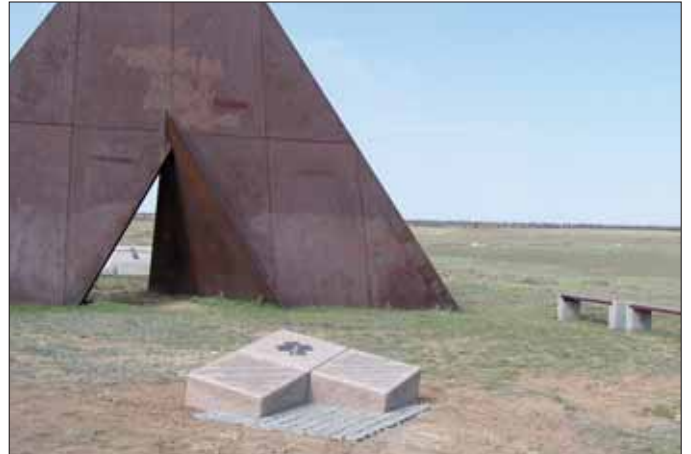
Kriegsgräberbetreuung im Ausland: Gymnasiasten der Theresianischen Militärakademie Wiener Neustadt im Friedenseinsatz auf dem Marinefriedhof Pula; Wolgograd: Mahnmal in Pestschanka für die österreichischen Opfer von Stalingrad.

dem Staat zur Erfüllung dieser humanitären Aufgabe eine zivile Organisation zur Seite zu stellen. Das erfolgte in einem Arbeitsübereinkommen zwischen dem Bundesministerium für Inneres und dem ÖSK, wobei die Verantwortlichkeit im BMI in der Sektion IV (Service und Kontrolle) angesiedelt ist. Das BMI und das ÖSK als Trägerverein tragen gemeinsam die Verantwortung über die Kriegsgräber. Allein in Österreich werden 918 Kriegsgräberanlagen von den ÖSK-Landesgeschäftsstellen betreut.