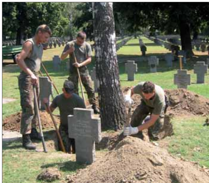
Kriegsgräberpflege: Gardesoldaten im Arbeitseinsatz auf dem Wiener Zentralfriedhof.

Im Gegensatz zu anderen Staaten, in denen die Kriegsgräberfürsorge ausschließlich behördlicherseits wahrgenommen wird, steht der Republik