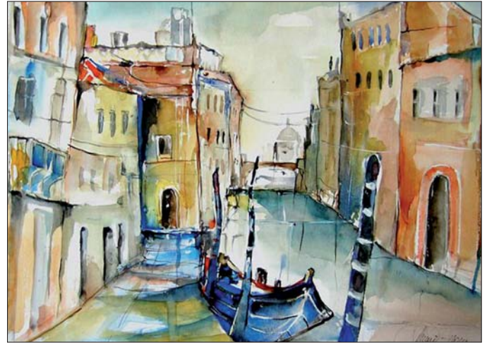
Bevorzugte Motive des Künstlers in der Aquarellmalerei sind Orte und Landschaften.