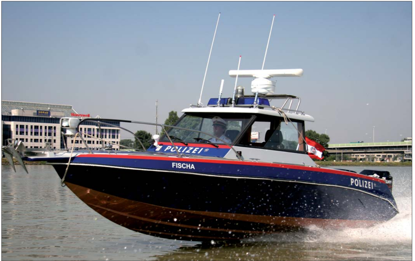
Der Streifenbereich der Fachinspektion Handelskai erstreckt sich auf der Donau über eine Länge von 70 Kilometern sowie auf die anderen Gewässer, Teiche und Seen in und um Wien.

„Kriminaldienst“ sowie „Umwelt- und Katastrophenschutz“. Alle Bediensteten der Inspektion sind nautisch ausgebildet. Sie verfügen zusätzlich zur polizeilichen Ausbildung über Patente zum Polizeischiffsführer, ein nautisches Sprechfunkzeugnis, Kenntnisse über Schiffsbau und Schiffstechnik, sie haben eine Rettungsschwimmerausbildung, eine Erste-Hilfe-Ausbildung, eine Radareinschulung, eine Gefahrengutschulung, eine Ausbildung zum Umweltkundigen Organ und eine Strahlenschutz Ausbildung. Zur Ausrüstung gehören acht Einsatzboote und drei Einsatzfahrzeuge. Eines davon ist als Funkstreifenwagen „Theodor 9“ im Einsatz. „Wir bestreifen unser Streifengebiet auf dem Wasser nicht nur mit Booten, sondern auch mit dem Einsatzwagen entlang der Treppelwege zwischen Altenwörth, Tulln, Greifenstein, Wien bis Mannswörth“, berichtet Kraus.