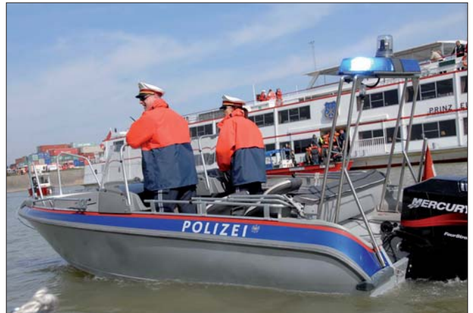
Rettungseinsätze, Bootsstreifen und Schiffskontrollen gehören zu den Hauptaufgaben der See- und Strompolizisten.