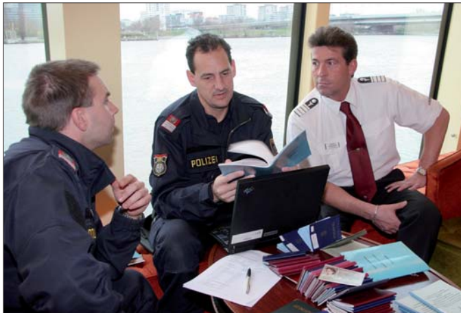
Beamte der Polizeiinspektion Handelskai: Überprüfung von Besatzung, Ladung und Schiffsdokumenten.