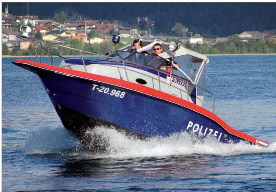
In Österreich gibt es 33 Dienststellen, die neben ihren allgemeinen polizeilichen Aufgaben schiffahrtspolizeiliche Arbeiten erledigen.

im Landesinneren Ausgleichsmaßnahmen durchgeführt, vor allem Kontrollen. Das wird von eigenen AGM-Dienststellen erledigt. Die polizeilichen Kontrollen auf der Donau erfolgen von den Beamten des See- und Stromdienstes der Bundespolizei erledigt; in Wien von der Fachinspektion Handelskai/See- und Stromdienst.