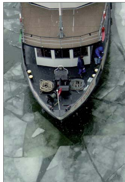
„MS Eisvogel“ auf der Donau: Polizisten als Eisbrecher unterwegs.

50 Wasserfahrzeuge – in der Größe von vier bis über 20 Meter Länge – stehen dem schiffahrtspolizeilichen Dienst zur Verfügung. Neben einfachen Holzbooten gibt es bis zu 309 PS starke Schiffe. Eines davon wird beispielsweise am Bodensee eingesetzt.