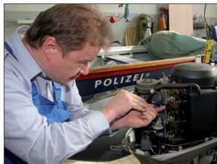
Service- und Reparaturarbeiten der Polizeiboote erfolgen in der eigenen Werftanlage der Inspektion Handelskai.

378 Menschen bargen die Beamten der Fachinspektion Handelskai 2009 aus den Gewässern. 351 von ihnen waren in Seenot und 14 Menschen wurde das Leben gerettet. Die Beamten mussten 13 Wasserleichen bergen. Neben dem Polizeidienst auf dem Wasser erledigen die Beamten der Fachinspektion die Aufgaben einer sonstigen Polizeiinspektion. Dazu gehören Festnahmen von Straftätern, Vorführungen zu