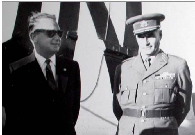
UNO-Generalsekretär Dag Hammarskjöld und der erste UNTSO-Kommandant Generalmajor Carl van Horn 1960.

heimgeschickt, mit der offiziellen Begründung, dass der Personalstand im Libanon reduziert werden müsse. Inoffiziell wurde bekannt, dass sich nachträglich herausgestellt hätte, dass sie die Voraussetzungen für den UNO-Dienst nicht erfüllt hätten. Ein weiterer Beamter ging in eine „Honigfalle“ des israelischen Geheimdienstes und wurde erpresst. Auch er musste aus dem UNO-Dienst ausscheiden.