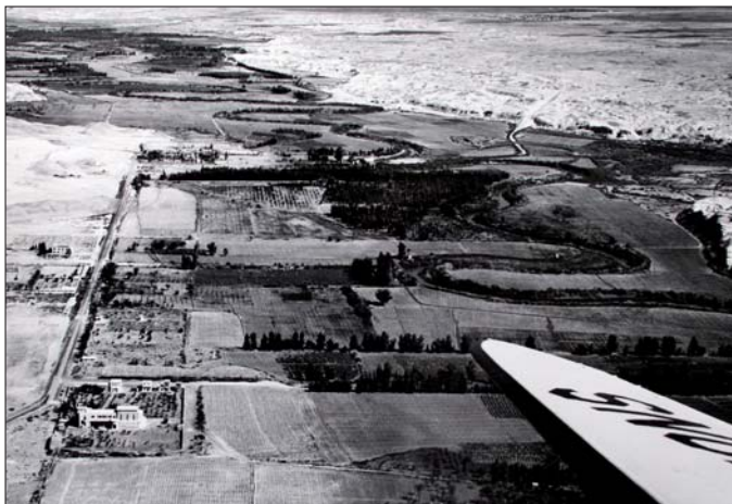
UNTSO-Beobachterflug im Jordantal 1960: Polizist Ottokar Chvosta flog als Fotograf mit.