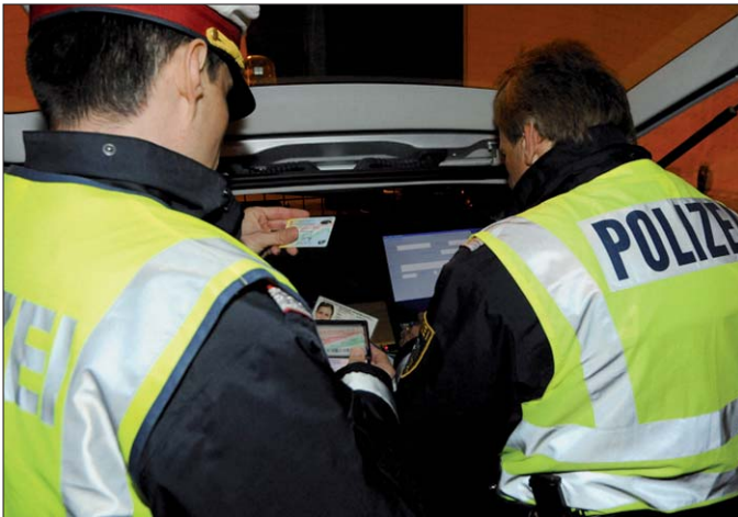
Fahrzeugkontrolle von Polizisten der Soko Kfz in Nickelsdorf: Die intensiven Maßnahmen führten bereits zu einer Verdrängung der Autodiebstahlsbanden.