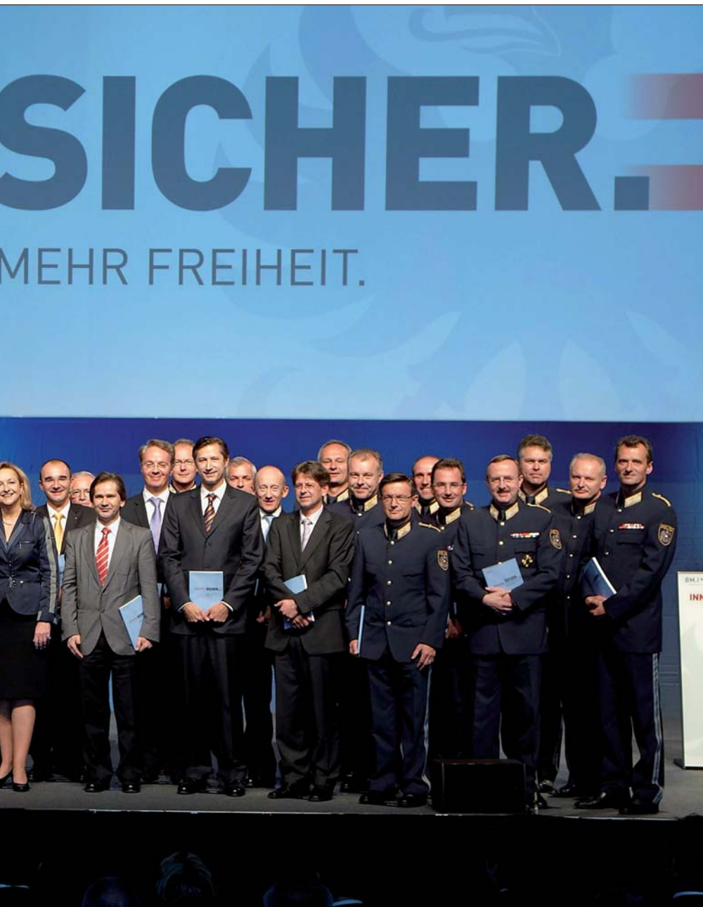
Linz: Innenministerin Maria Fekter mit Führungskräften des Innenressorts.

berechenbare Zukunft für die Menschen, keine Lebensqualität, keine Freiheit und keine Ordnung.“ „Sorgen Sie mit Ihrem Wissen, mit Ihrer Erfahrung und mit Ihrer vorbildlichen Einstellung dafür, dass unsere Strategie konsequent in die Tat umgesetzt wird“, appellierte die Innenministerin an die Führungskräfte. „Arbeiten wir gemeinsam für unser Land! Die Österreicherinnen und Österreicher haben ein