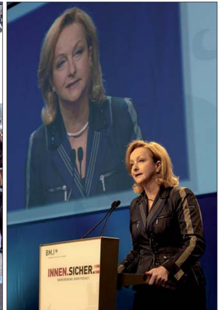
Teilnehmerinnen und Teilnehmer der Führungskräftetagung in Linz; Innenministerin Maria Fekter: „Wir entwickeln die innere Sicherheit Österreichs mit klaren Zielen und Schwerpunkten weiter.“

Migration steuern: Menschen kommen bzw. wollen nach Österreich, um hier zu leben und zu arbeiten. Es gilt, Migration gezielt nach den Bedürfnissen Österreichs zu steuern. Integration fördern und fordern: Integration stärkt den sozialen Frieden und erhöht den wirtschaftlichen Erfolg. Integration ist Aufgabe und Verantwortung jedes Einzelnen. Nur wenn alle Beteiligten eine entsprechende Bereitschaft zeigen, kann Integration erfolgreich sein. Es gilt, die notwendigen Rahmenbedingungen bereitzustellen und alle relevanten Akteure zu koordinieren.