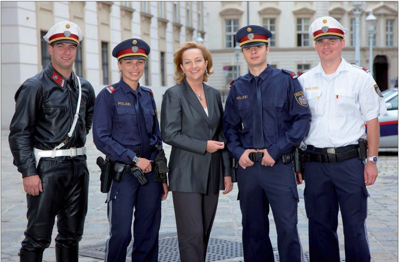
Bundespoleizei: „Ich will, dass Exekutive und Behörde nicht nebeneinander, sondern ineinander verzahnt arbeiten.“

nen und Mitarbeitern auch in schwierigen Situationen stehen. Loyalität heißt auch, dass bei Führungsentscheidungen die Mitarbeiterinnen und Mitarbeiter ihre Erfahrungen und ihr Know-how einbringen können, um zu den besten Lösungen für unsere Aufgabenerfüllung zu gelangen. Nach einer solchermaßen getroffenen Entscheidung handeln alle Mitarbeiterinnen und Mitarbeiter gemäß dieser Entscheidung. Rechtsstaatlichkeit hat jedoch Vorrang vor Loyalität. Unser rechtsstaatliches Handeln erfolgt unabhängig von unserer persönlichen, ideologischen, politischen oder religiösen Überzeugung.