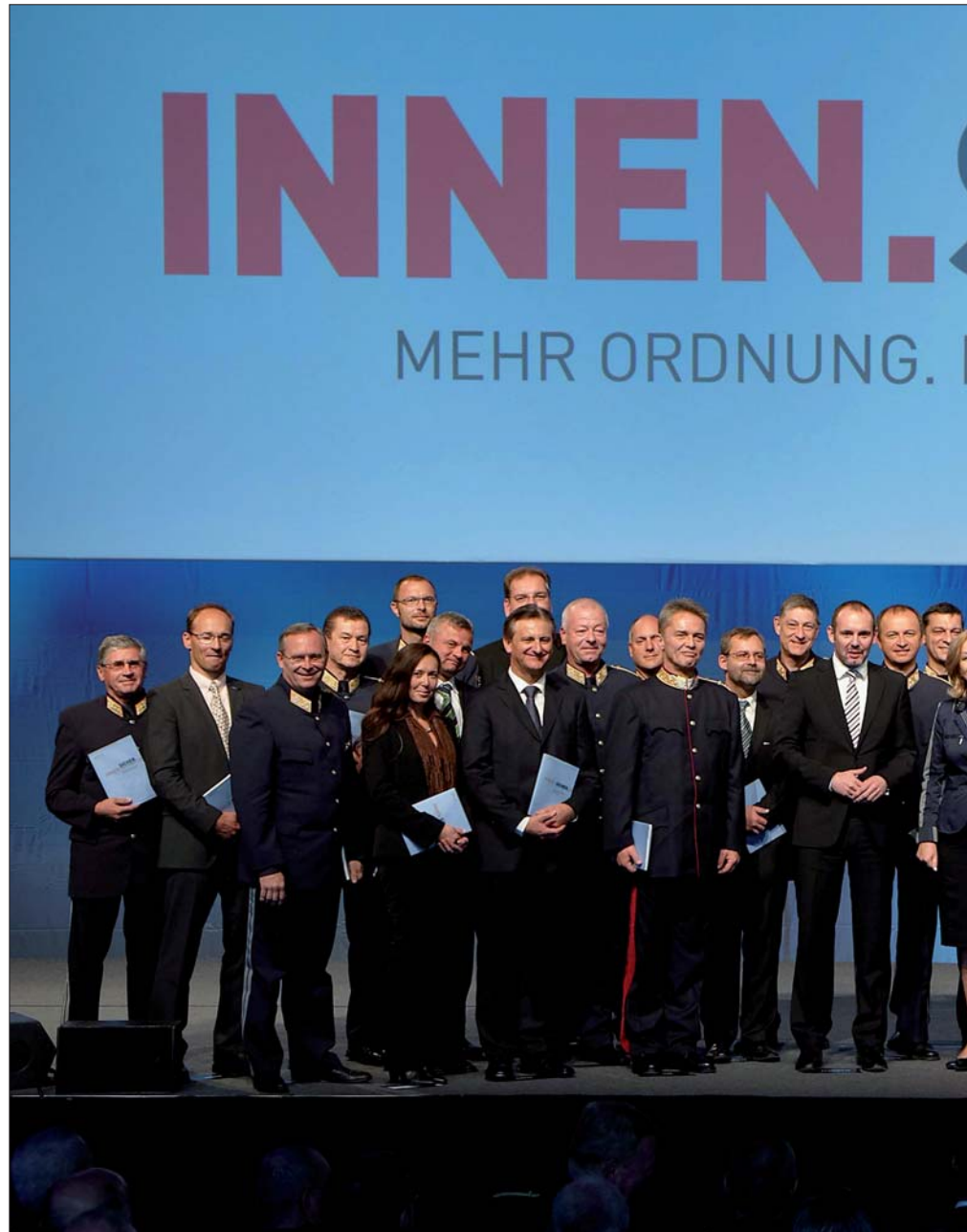
Vorstellung der Strategie „INNEN.SICHER.“ bei der Führungskräfte-tagung am 13. Oktober in Linz

Die Strategie wurde unter Federführung der Sektion I (Ressourcen) von