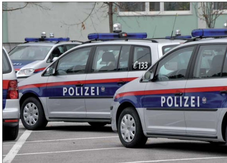
Neue Streifenwagen der Bundespolizei: „Streifeninitiative“.

Die Umsetzung der 57 Teilprojekte erfolgt stufenweise entsprechend ihrer Dringlichkeit, ihres Vorbereitungs-