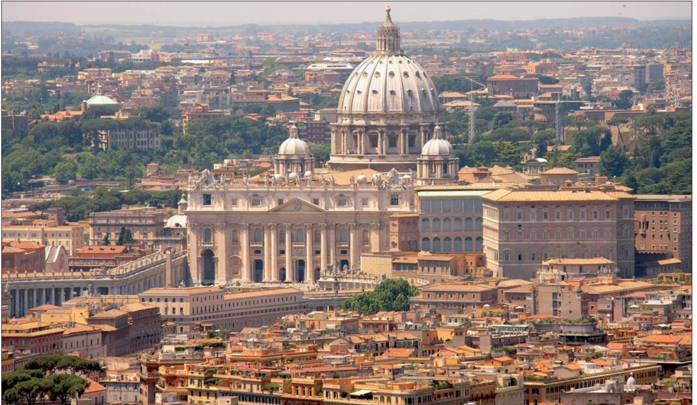
Vatikan: Das kanonische Recht regelt die inneren Angelegenheiten der katholischen Kirche. Es gibt auch Strafbestimmungen.