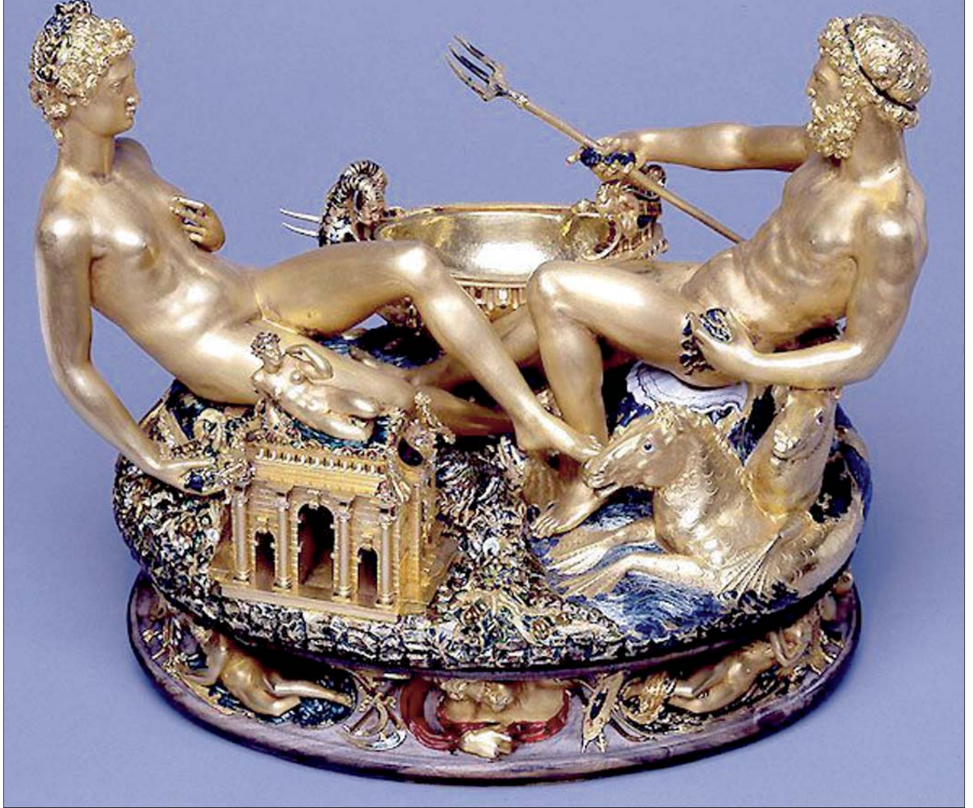
Der Diebstahl der Saliera von Benvenuto Cellini war der bisher schwerste Kunstdiebstahl in Österreich.